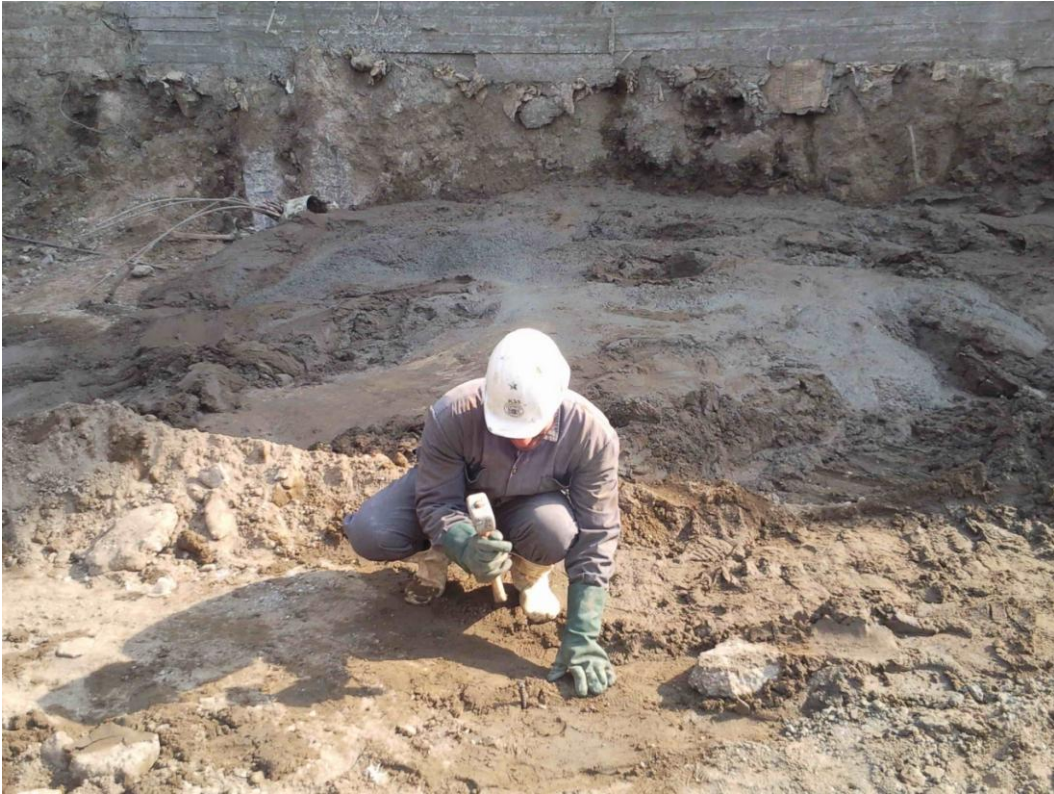
تحديد مركز الخازوق بواسطة سيخ حديد