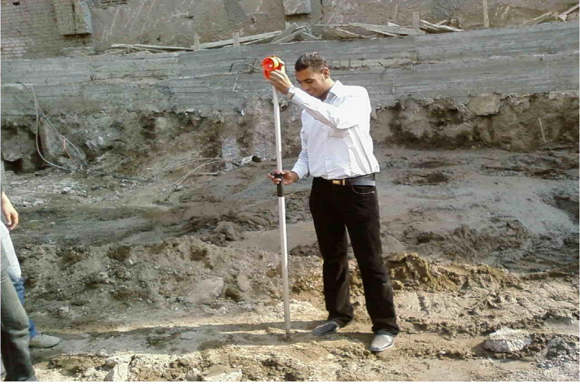
توقيع إحداثي الخازوق باستخدام جهاز الـ (total station)