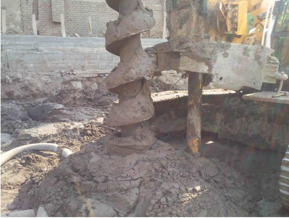
عملية سحب البريمة أثناء ضخ الخرسانة