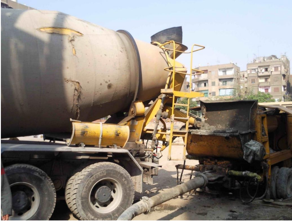
دخول عربة الخرسانة على المضخة