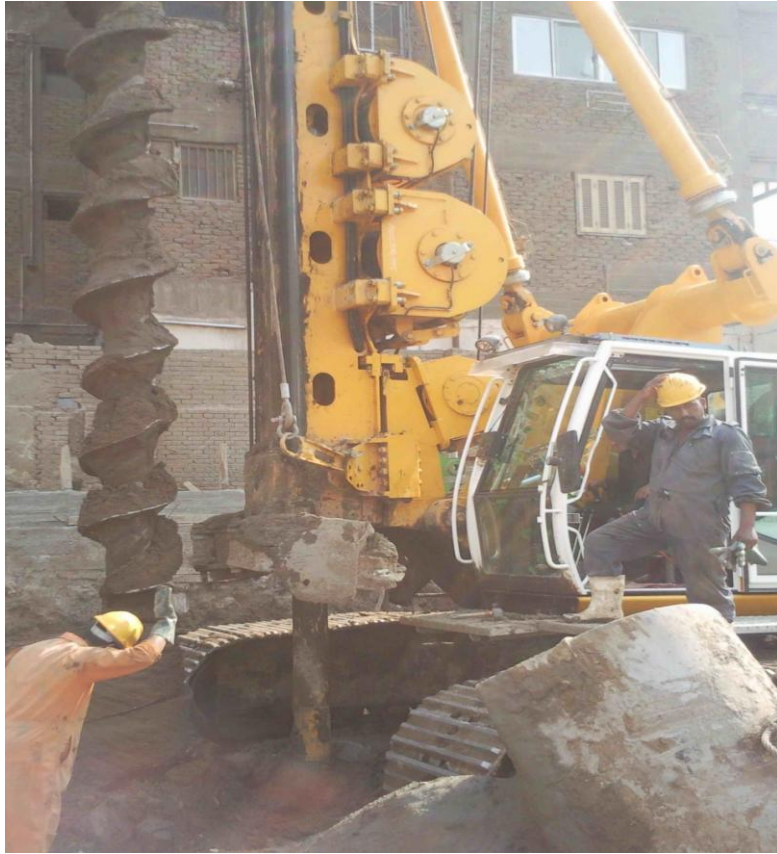
ضبط الماكينة على مركز الخازوق