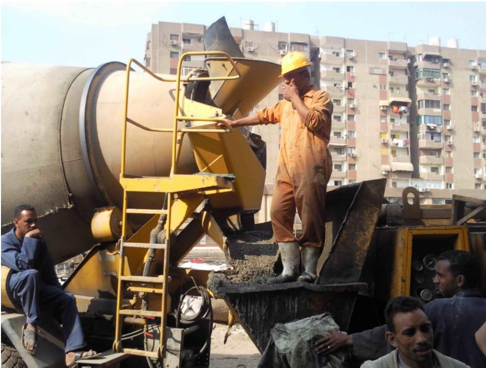
عملية ضخ الخرسانة إلى الخازوق بواسطة المضخة