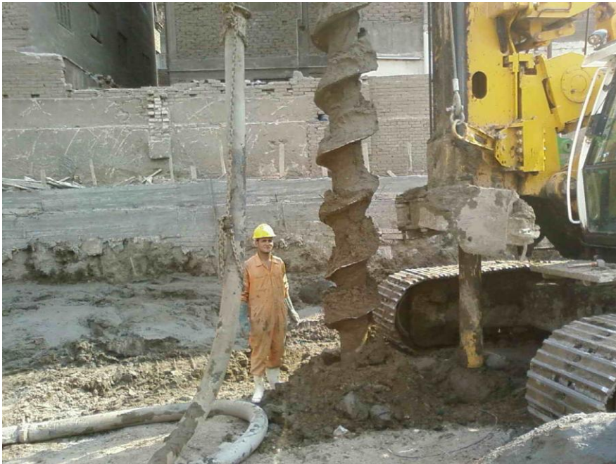
عملية حفر الخازوق