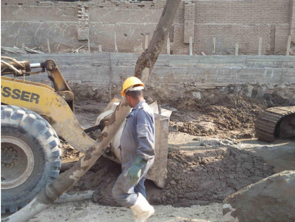
إزالة ناتج الحفر أعلى الخازوق بواسطة اللودر ليتم إنزال التفقيصة