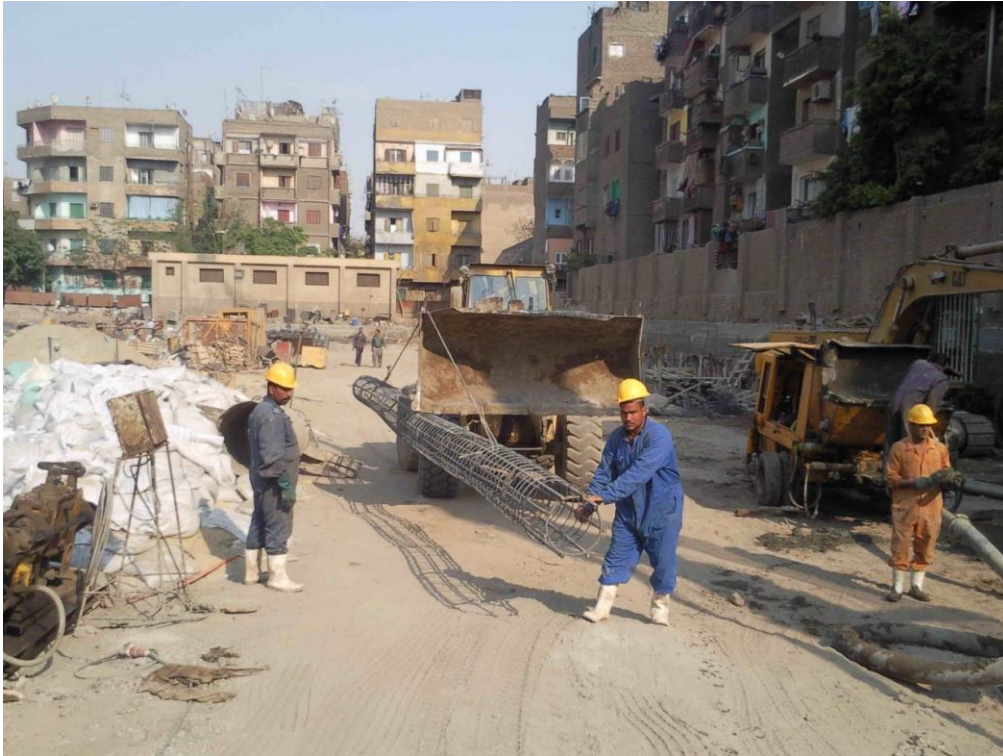
إحضار التقفيصة الحديد بواسطة اللودر