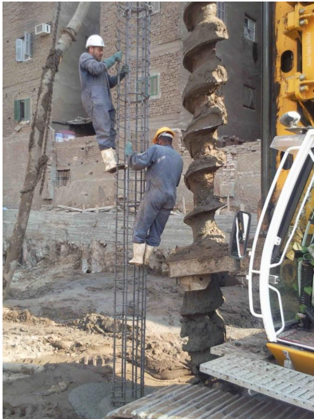
أثناء إنزال التفقيصة الحديد