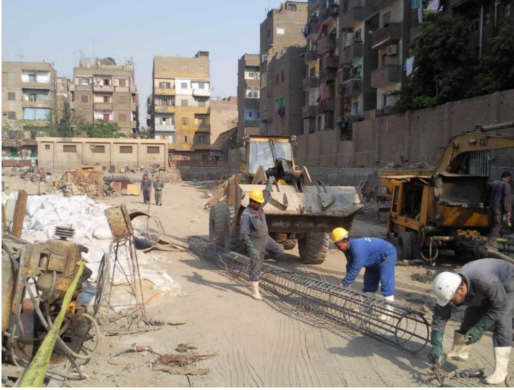
تجهيز التفقيصة الحديد لإنزالها بالخازوق