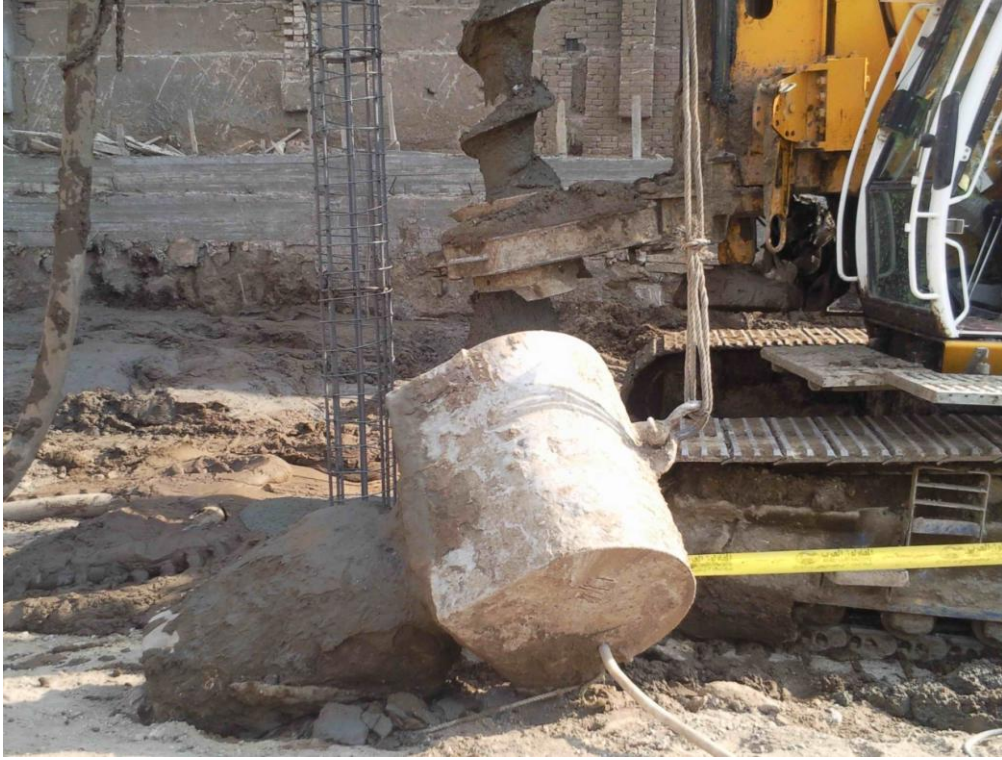
الهزاز المستخدم لإنزال التفقيصة الحديد