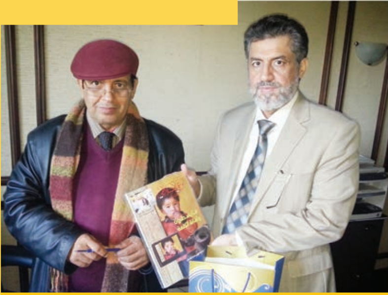
رئيس التحرير يهدي مدير المؤسسة أحد أعداد المجلة

في المؤسسة أكثر من ٢٠٠ مجلة وصحيفة. الكتب الأجنبية: وهي الكتب والمجلات المكتوبة بغير العربية من الفارسية والفرنسية والإنجليزية وغيرها. ويبلغ عددها زهاء ألفي مجلد. الوثائق: تشمل خزانة علال الفاسي على كم هائل من الوثائق المتعلقة بتاريخ الحركة الوطنية المغربية والمغربية، بما فيها الرسائل المتبادلة بين صاحب الخزانة وعدد من الشخصيات المغربية والعربية والإسلامية والأجنبية. مجموعة من الصور الفوتوغرافية: للزعيم المرحوم علال الفاسي، وشخصيات أخرى وطنية وعربية ودولية، لها قيمة خاصة في تاريخ المغرب الحديث.