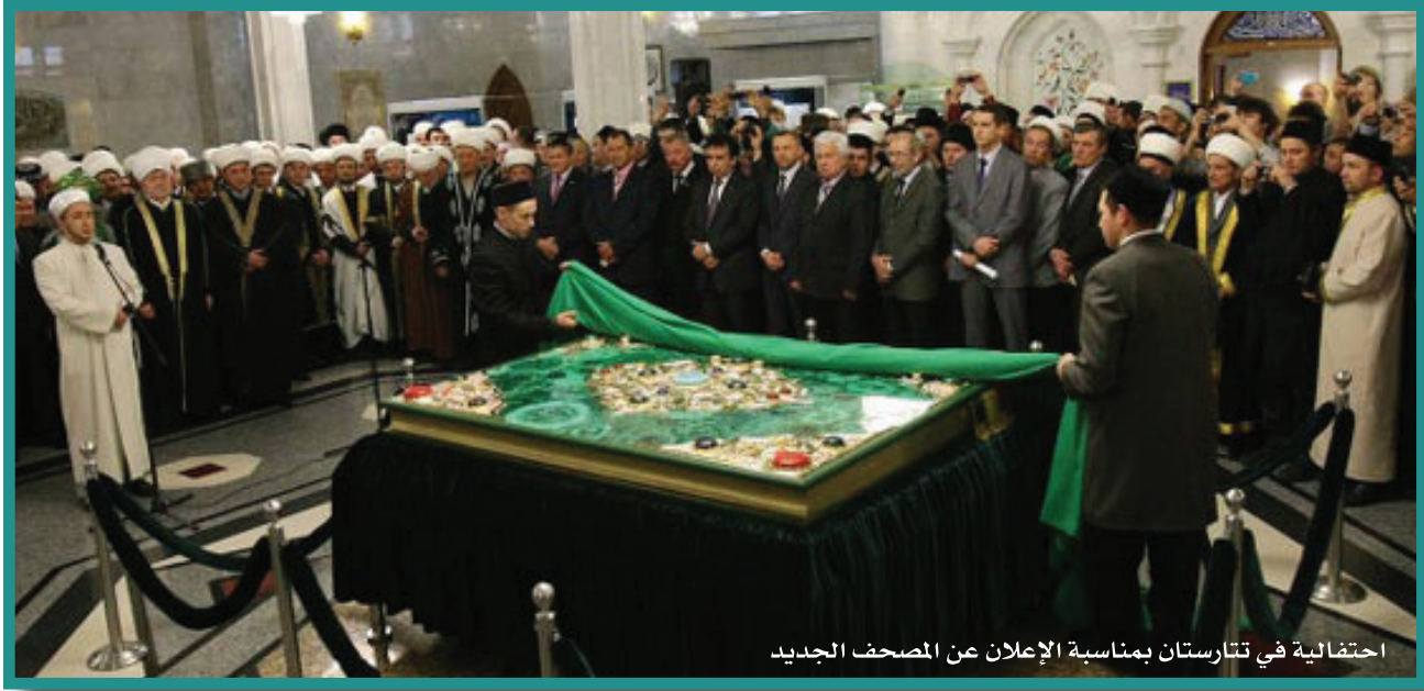
احتفالية في تترستان بمناسبة الإعلان عن المصحف الجديد

القولغا، بل تجاوزها إلى منطقة القرم في شمال البحر الأسود، غير أن الدفعة الأساسية للدعوة الإسلامية في حوض القولغا وصلت بإسلام التتار، فعندما احتلتها قياصرة روسيا في سنة (٩٦٠هـ - ١٥٥٢م) كان الإسلام منتشرًا بين سكانها، واضطهد أهلها، وحاول الروس جذبهم إلى المسيحية بالقوة والقهر، ولكنهم فشلوا، ولقد بذلت الإمبراطورة كاترين الثانية جهودًا جبارة في هذا المجال في سنة (١١٩٢هـ - ١٧٧٨م)، فأمرت بأن يوقع معتق المسيحية (الجديد) على إقرار كتابي يتعهد فيه بترك «خطاياها»، ويتجنب الاتصال بالكفار، ويظل على الدين المسيحي، وطبق هذا بالقوة على التتار المسلمين، ولكنهم كانوا مسيحيين أسما، ثم تخلصوا من هذا التعسف، وظلوا على إسلامهم. ولقد دونت أسماؤهم في السجلات المسيحية زورا، ووقف التتار في ثبات وقوة ضد المنصرين وحملاتهم، وشهد القرن التاسع عشر الميلادي عدة قوانين تحد من انتشار الدعوة، لدرجة أن القانون الجنائي الروسي كان يعاقب كل شخص يتسبب في