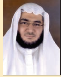
إعداد : د. محمود محمد الكبش الباحث بوحدة البحث العلمى -إدارة الإفتاء-