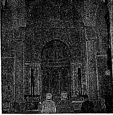
من صور الفن الإسلامي بأحد مساجد بنزرت في تونس