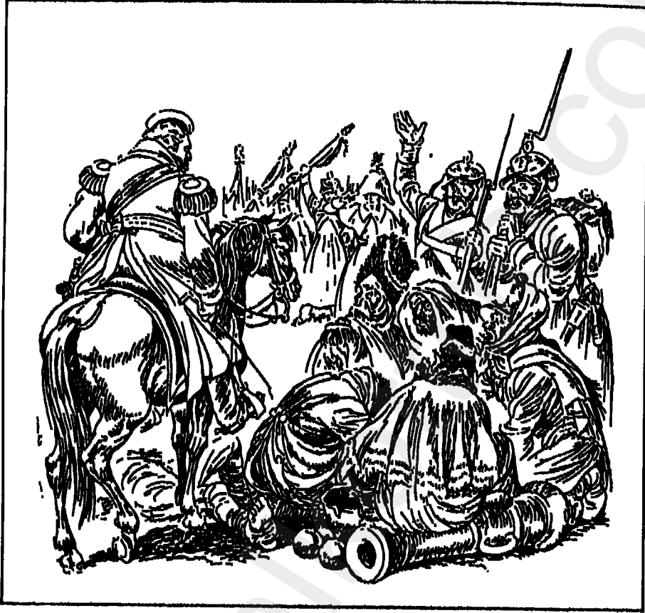
كوتوزوف يخطب في الجيش