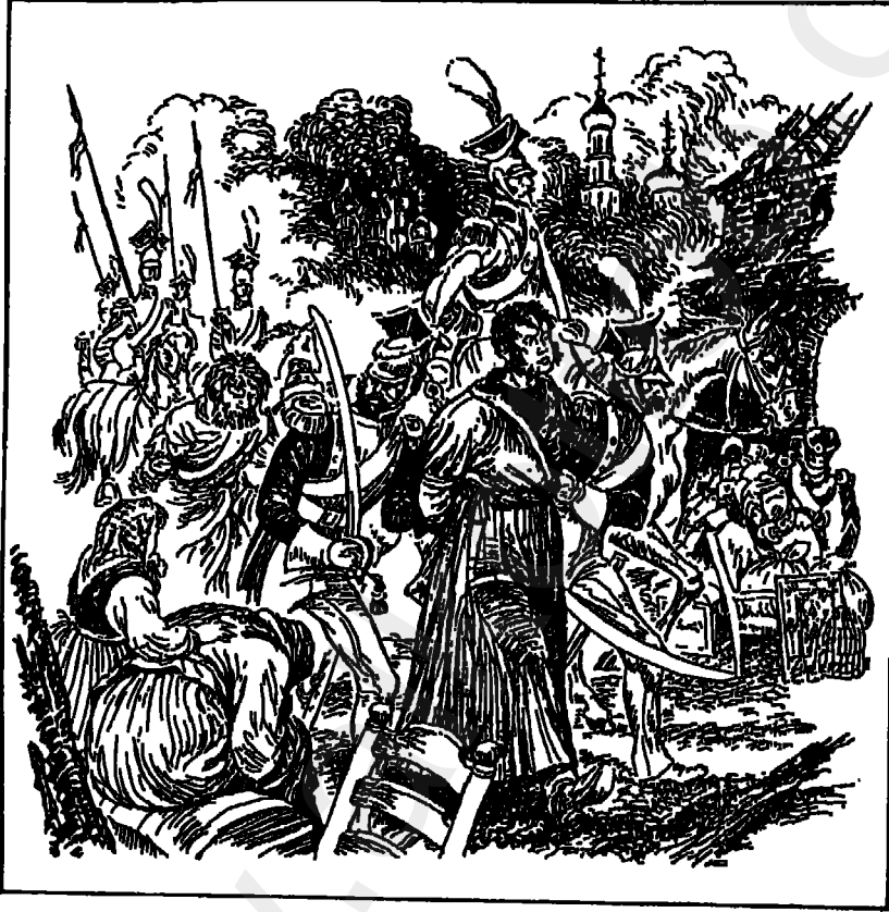
بطرس يساق أسيراً.