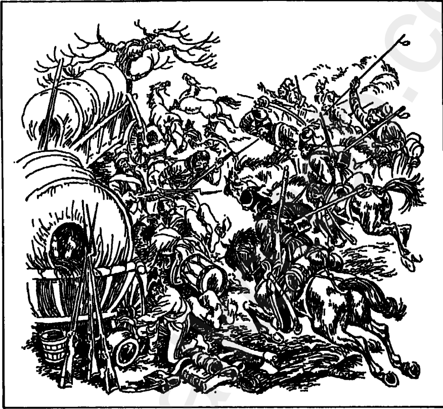
القوزاق تفاجيء جيش مورات.