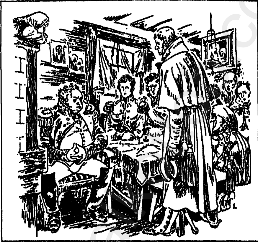
قنصل الحرب في ليبي .