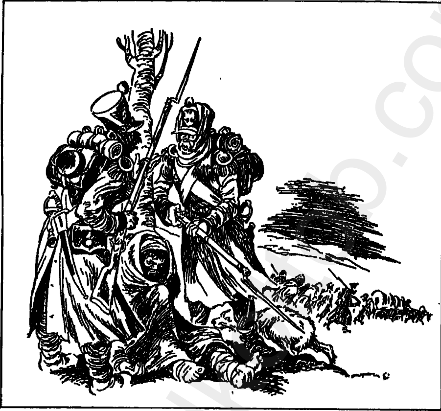
مقتل قائد الفصيل كاراتايف.