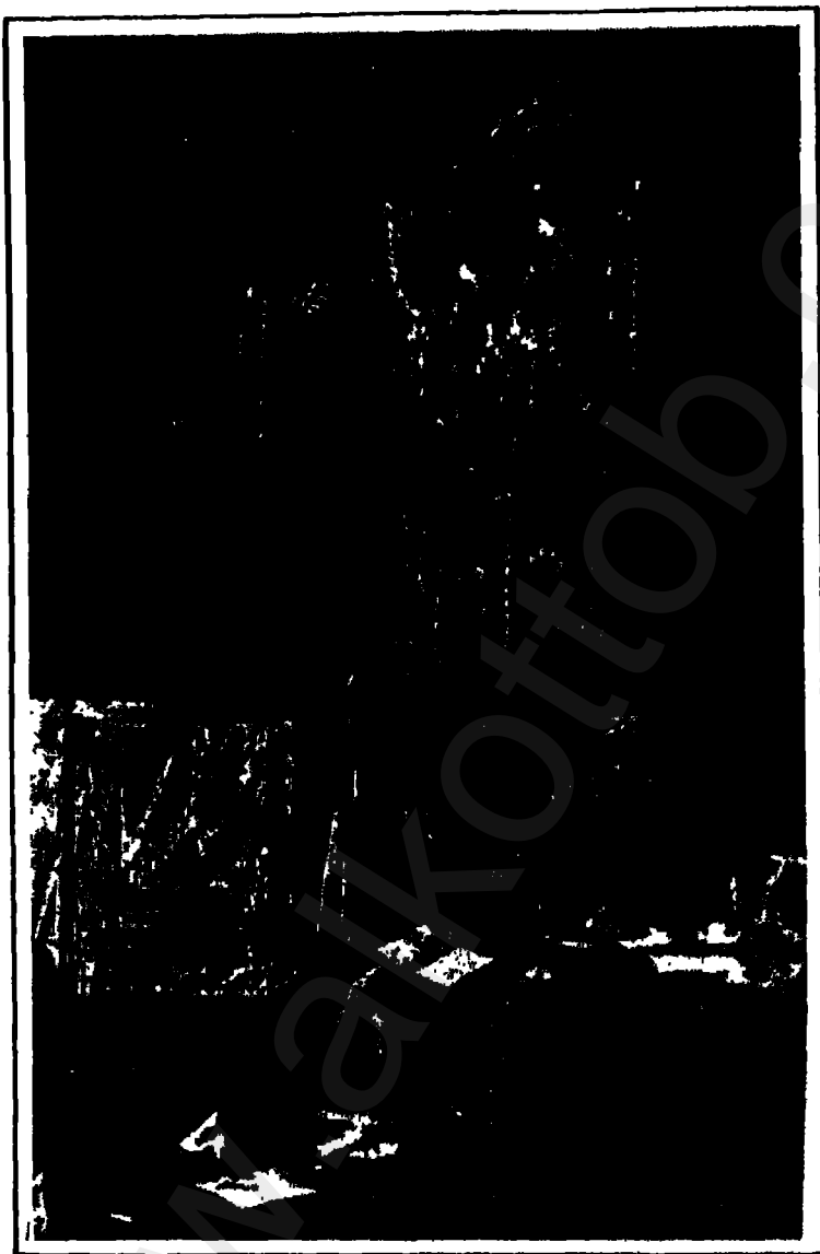
نابوليون بيعث رسالة.