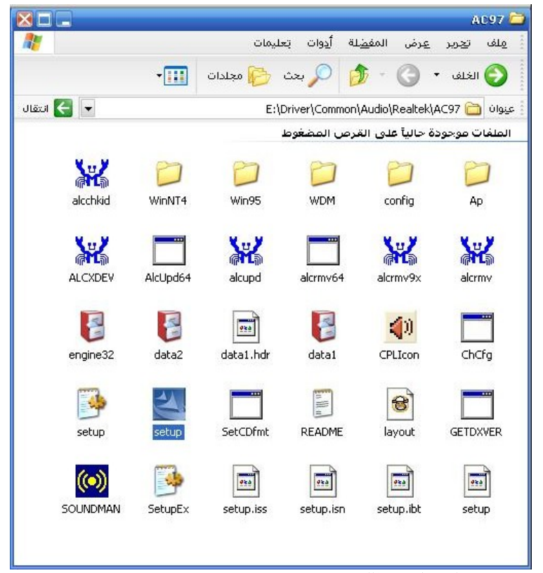
ونبداء في التحميل بعد ذلك