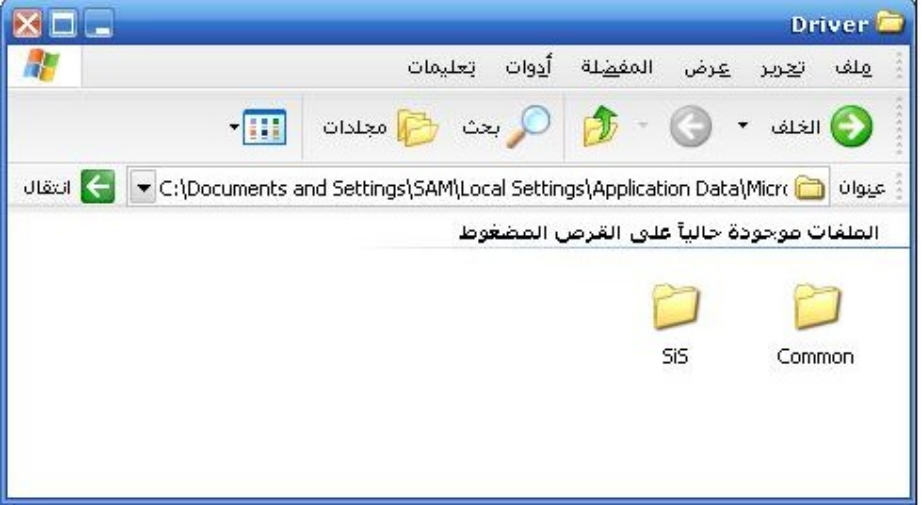
والضغط على مجلدSIS تظهر النافدة التالية