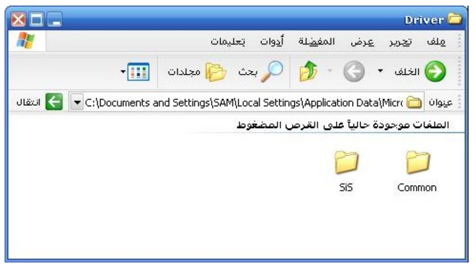
وعند الضغط على مجلد COMMON تظهر النافدة التالية