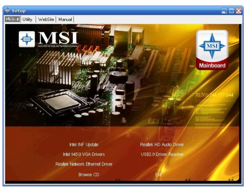
تلاحظ في الأسفل من الصورة أسماء التعريفات فنقوم بالضغط عليها وتحميلها واحدتلو الأخرى

لوكان نوع MAIN BORD أللوحه الرئيسية MSI وهي من اللوحات المشهور فتظهر واجهه بهذا الشكل