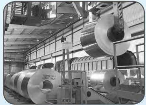
شكل (٢٨) صور توضيح الصناعات في دول الخليج العربية