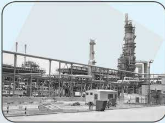
شكل (٢٩) صور توضيح عملية تكرير النفط