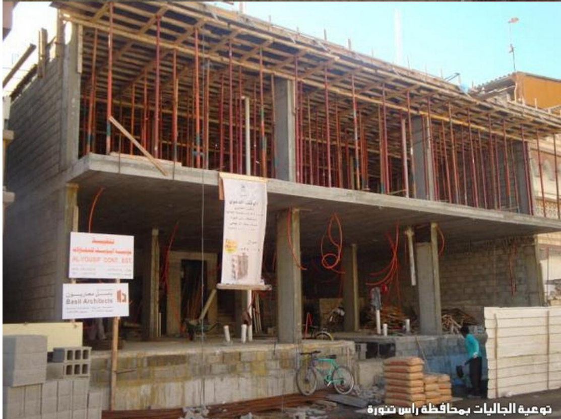
توعية الجاليات بمحافظة راس تنورة