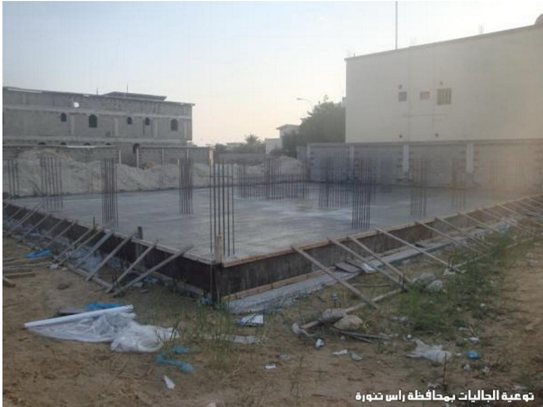
توعية الجاليات بمحافظة راس تنورة