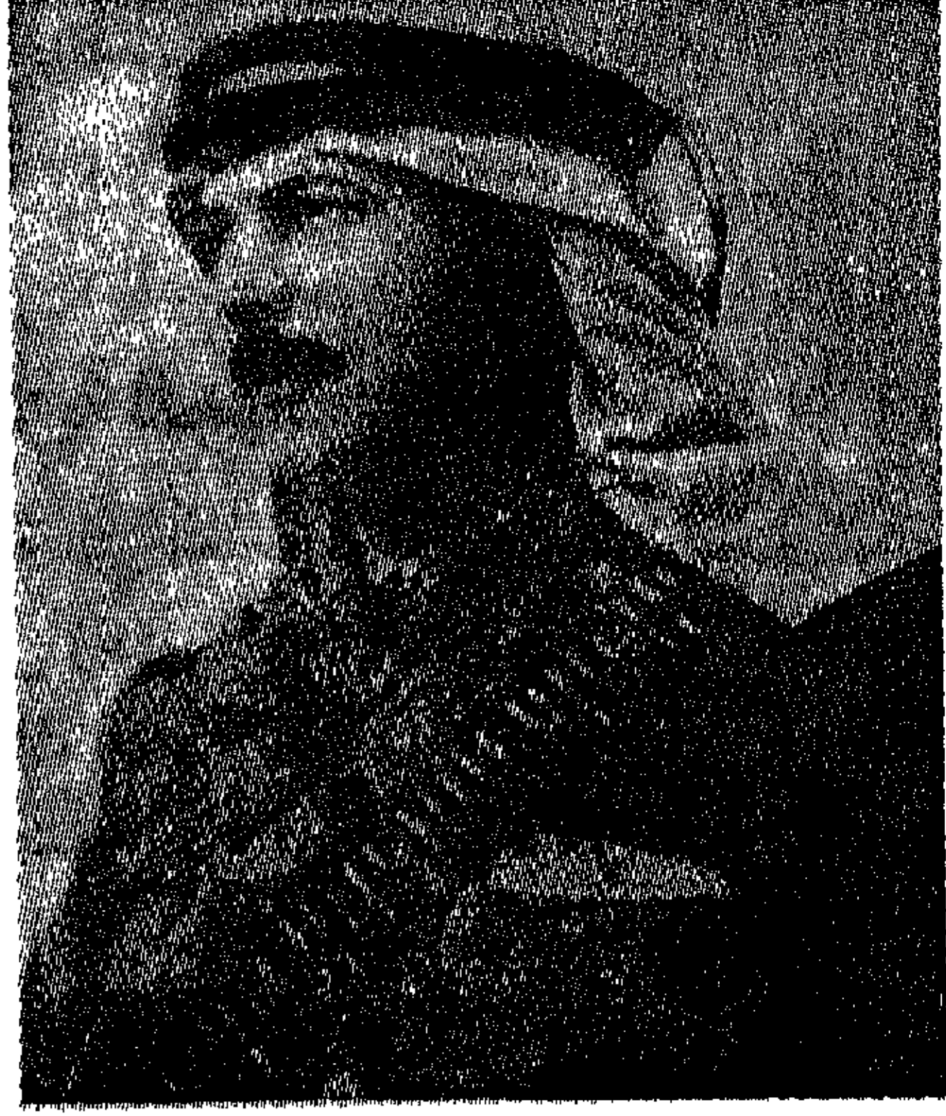
الشهيد القائد عبد القادر الحسيني

فقد كان يعمل كجهاز لنشر الدعاية للثورة .