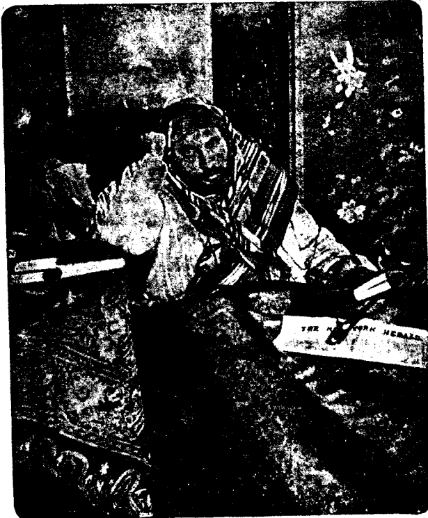
وهذه صورة السيد بعد العملية الجراحية

وقد بالغ الشيخ أبو الهدى في عداوته والكيد له حتى كان يسعى في ايذاء من يذكره بجبر أينما كان من بلاد الدولة . وكان يطعن في نسبه ودينه كما هي عادته فيمن يستاء منهم فانه يجردهم من اللباس الذي فصله وخطه لنفسه ولم يرضى عنهم من انصاره . وقد كتب إليّ في ٢٩ رجب سنة ١٣١٦ كتابا قال فيه « اني أرى جريدتك طاغية بشقاشق المتأفمن جمال الدين الملققة وقد تدرجت به الى الحسينية التي كان يزعمها زورا وقد ثبت في دوائر الدولة رسما انه ما زلت اني من اجلاف الشيعة .. وهو مارق من الدين كما مرق السهم من الرمية » وكذلك قال الشيخ أبو الهدى في امام الصوفية الشيخ عبد القادر الجيلي الذي هو من أشهر الشرفاء ، في كتب لفقها باسماء الاموات والاحياء ، ولا ندرى في أي دوائر الدولة يسجل شتم الناس فنصدق خبر أبي الهدى كذلك كان شأنه في الاستانة في آخر أيامه بمساعي أبي الهدى الى ان توفاه الله اليه