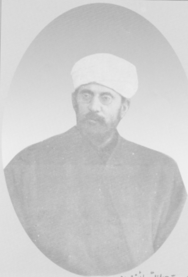
السيد جمال الدين الأفغاني