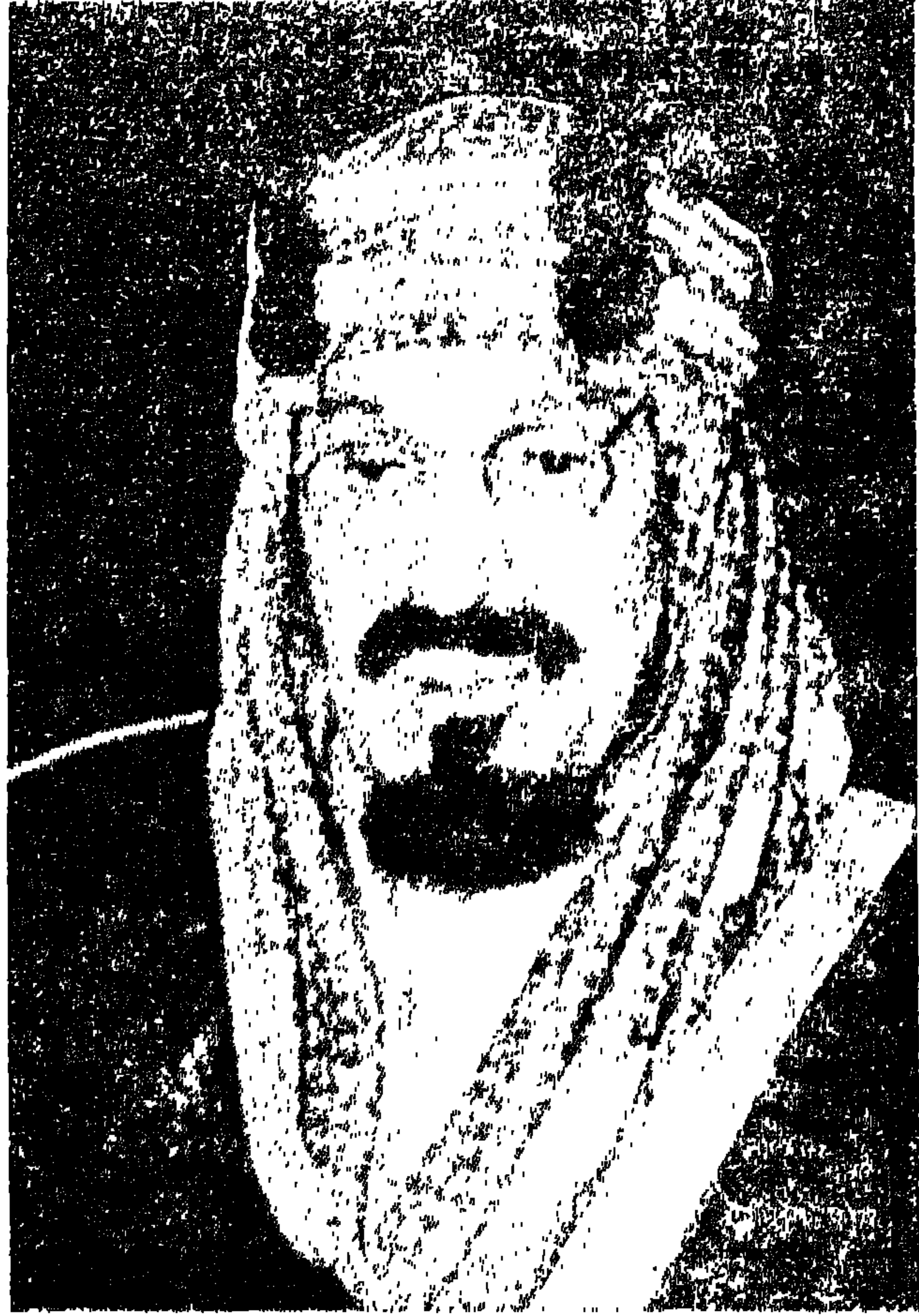
الملاك عبدالعزیز آل سعود