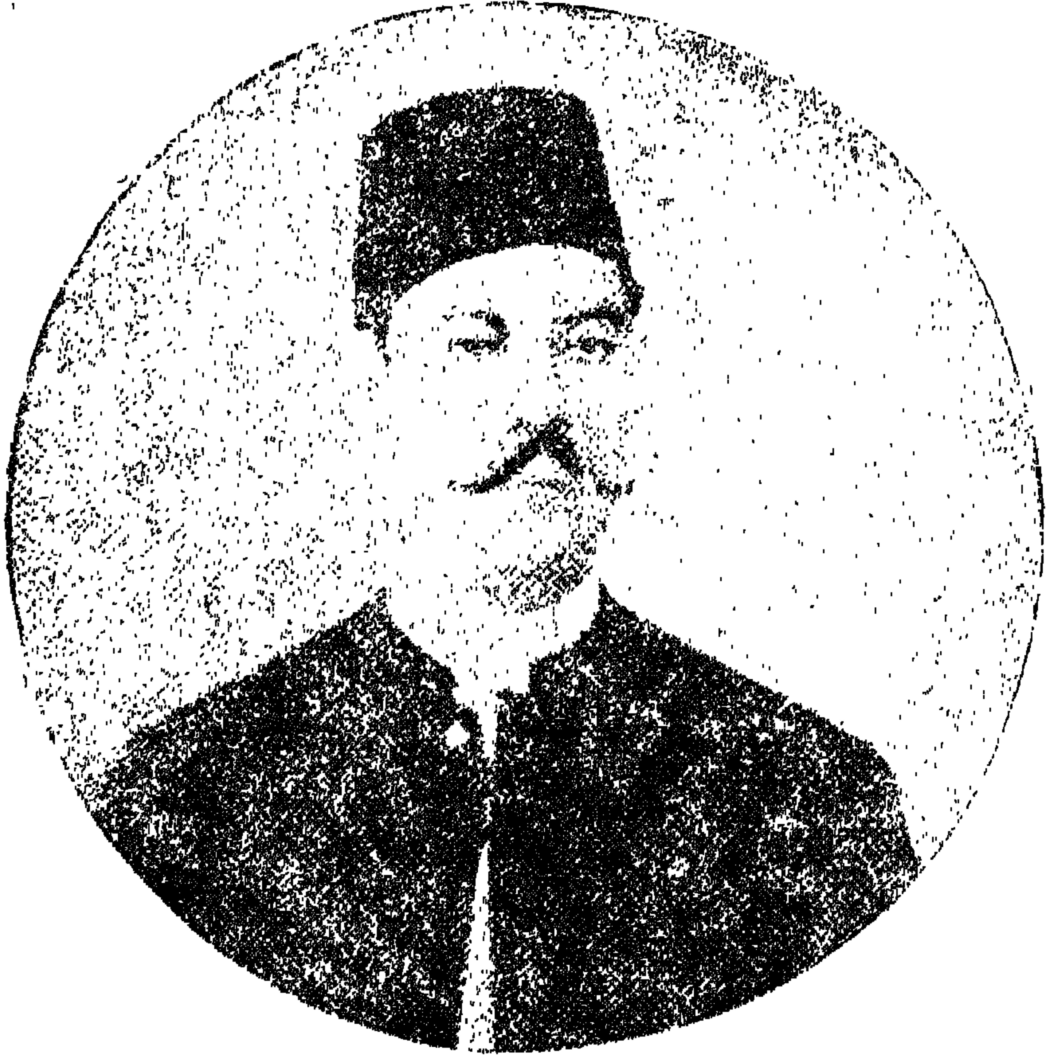
سعد زغلول المحامي في سنة ١٨٨٩