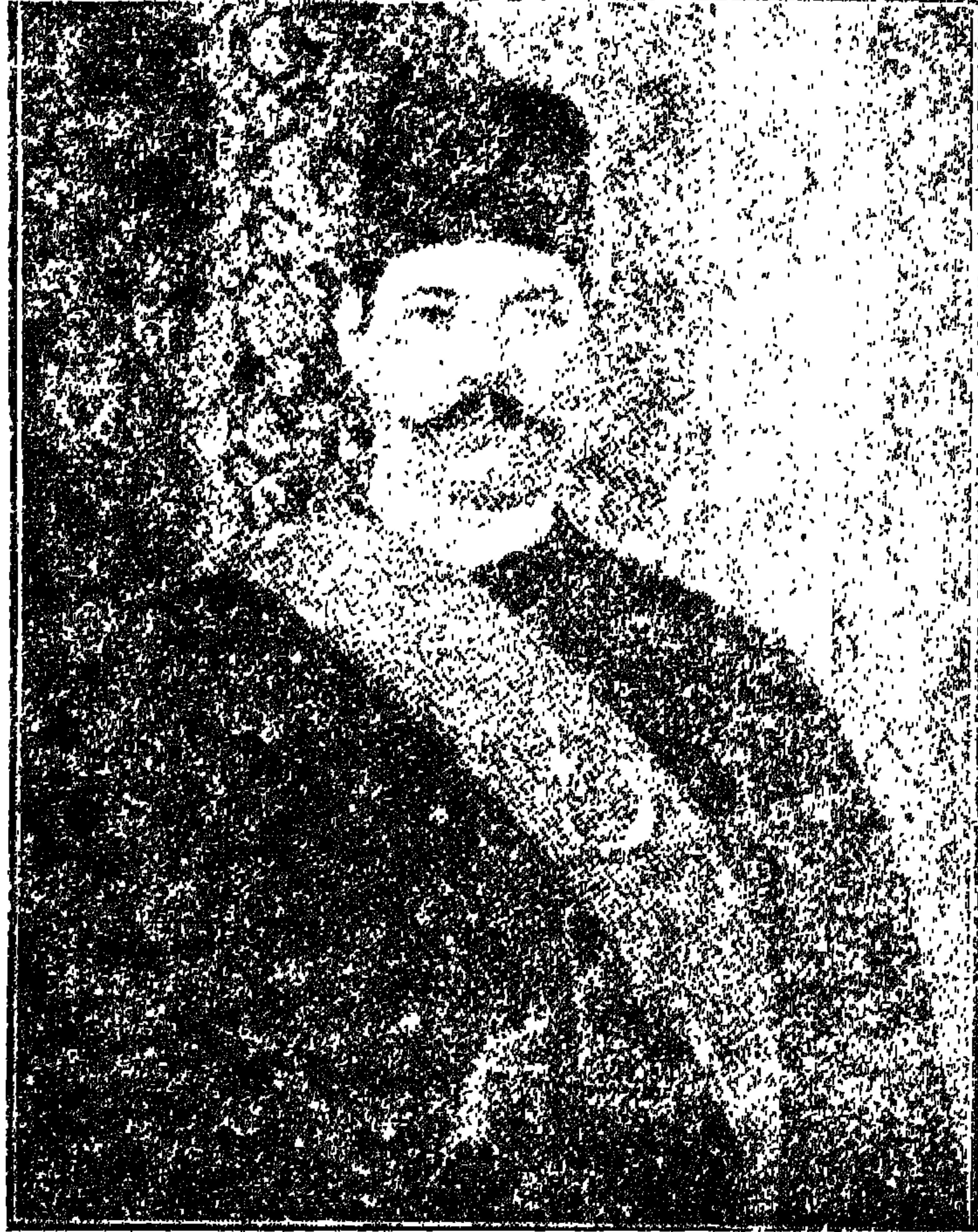
سعد زغلول المستشار في سنة ١٨٩٣