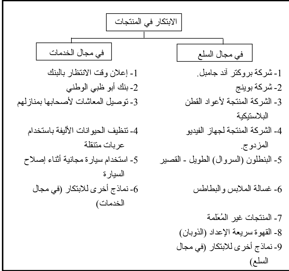
شكل رقم (1/5)

العرض تحليلاً للابتكار موضع الاعتبار و/ أو تعليقاً عليه، بحيث تتاح الفرصة للقارئ للإلمام بأبعاد مثل هذا الابتكار، وقدح الذهن للتوصل إلى ابتكارات مفيدة في مجال المنتجات، أو استنتاج عدد من الدروس التي يمكن إن تفيد في حالة فشل الابتكار في منتج معين أو أكثر. وفيما يلي عرض لعدد من الشركات والمنتجات فيما يتعلق بالابتكار موضع الاعتبار، مقسمة إلى مجالين هما: مجال السلع ومجال الخدمات. ويتضمن شكل رقم (1/5) قائمة بنماذج وحالات الابتكار التي يتم عرضها في هذا الفصل في مجالي السلع والخدمات.