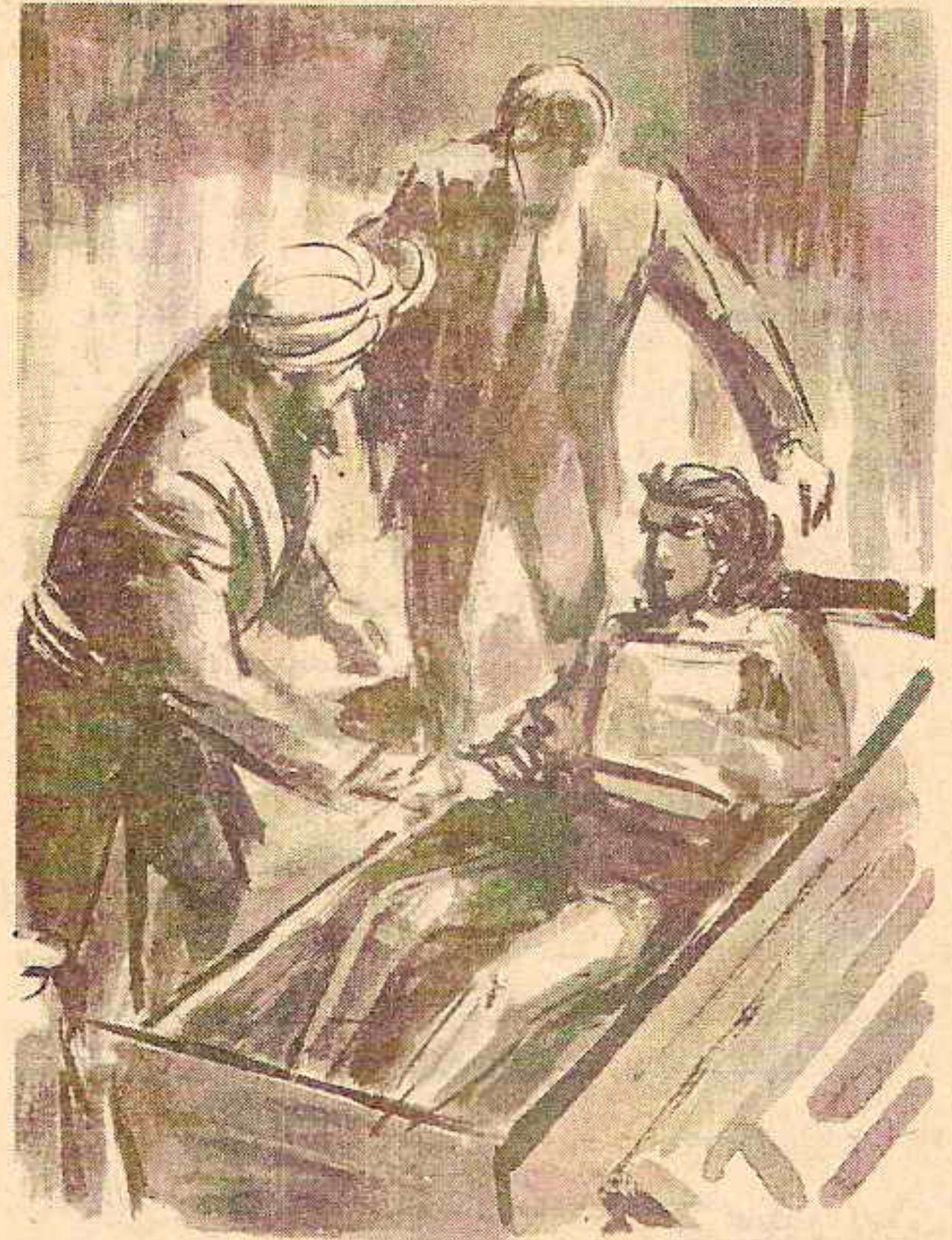
أمسك الساحر بيد الفتاة ليساعدها على مغادرة الصندوق وهو ينحني لجمهوره ..

وتنبهت حواسه إلى أن هناك خطراً حقيقياً يترصده .. فقاوم إحساسه بالإعياء .. وفتح عينيه إلى أقصى اتساعهما .