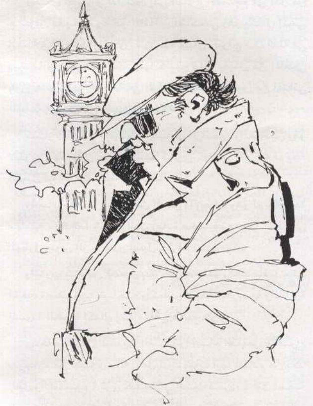
اقترب شخص قصير يدين ذى معطف رفعت ياقته حتى أخفت نصف وجه صاحبه

- والبائع .. أقصد الشخص الذى باع التاج إلى الوسيط