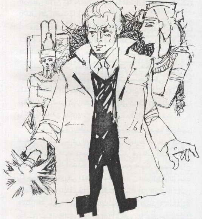
صار القناص في قلب المتجر المظلم . وتوقف متصنّتا

كان القناص واقفاً مستغرقاً تماماً حتى أنه لم يحس بالخطوات التي اقتربت من خلفه بخفة مثل خفة الفهد ، وارتفعت يد خلفه تحمل سيفاً بتاراً وتأهب العدو الخفى في خفة لأن يهبط به فوق رأس القناص . ولسوء حظ العدو -