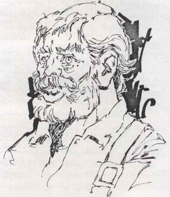
نهض الرجل مترنحاً وهو يقول : لقد حان موعد عودتى

فى صباح اليوم التالى كان كل شيء قد تم ترتيبه فى الليلة السابقة .. وخطا القناص باتجاه بوابة القصر التى تتبعها عدة بوابات أخرى ، كان الصباح غائماً وقد انتشر الضباب حتى لا يكاد المرء يرى أمثاراً قليلة أمامه . وكانت فى يد القناص حقيبة بنية متوسطة الحجم كان يحملها بسهولة برغم ثقلها . ونبحت كلاب البولودج الرهيبة عندما شممت رائحة القناص وسمعت خطواته المقتربة ، ثم ظهر من خلال الضباب الكثيف شيخ حارس يرتدى ملابس ثقيلة وقد وضع بندقيته كبيرة فوق كتفه وقال القناص : إن اللورد بانتظارك بالداخل . ومرا من خلال البوابات العديدة التى يحيط بها الحراس إلى داخل القصر ، وقاده الحارس إلى قلعة واسعة ارتص بها