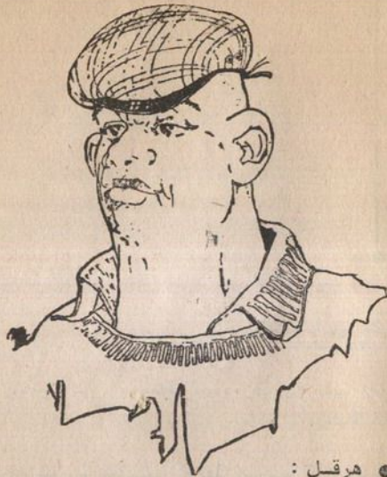
● هرقل :

العضو الثالث بالفرقة .. صورة مشابهة للرجل الاخضر الخرافي .. هائل الحجم .. يطلقون عليه اسم « الدبابة البشرية » .. قادر على تحطيم جدار من الصخر بضربة من رأسه .. لا مثيل لقوته البشرية ولا يستعمل أى سلاح لانه يكره الأسلحة ولا يحتاج إليها .. فإن ضربة واحدة من قبضته .. كفيلا بأن ترسل من تصيبه إلى جهنم !