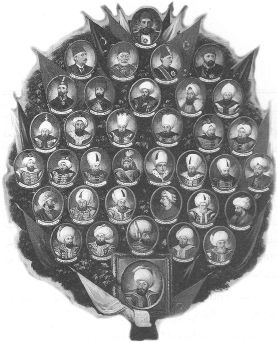
سلطانين بني عثمان