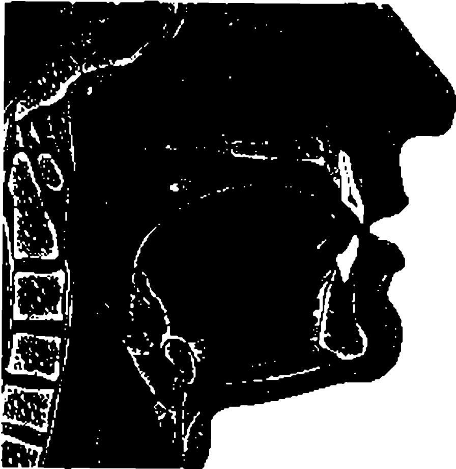
تجويف الفم وبلع الطعام