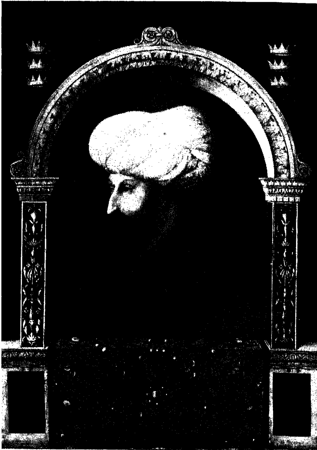
- صورة السلطان محمد الفاتح ، بريشة الرسّام جنتلي بليني