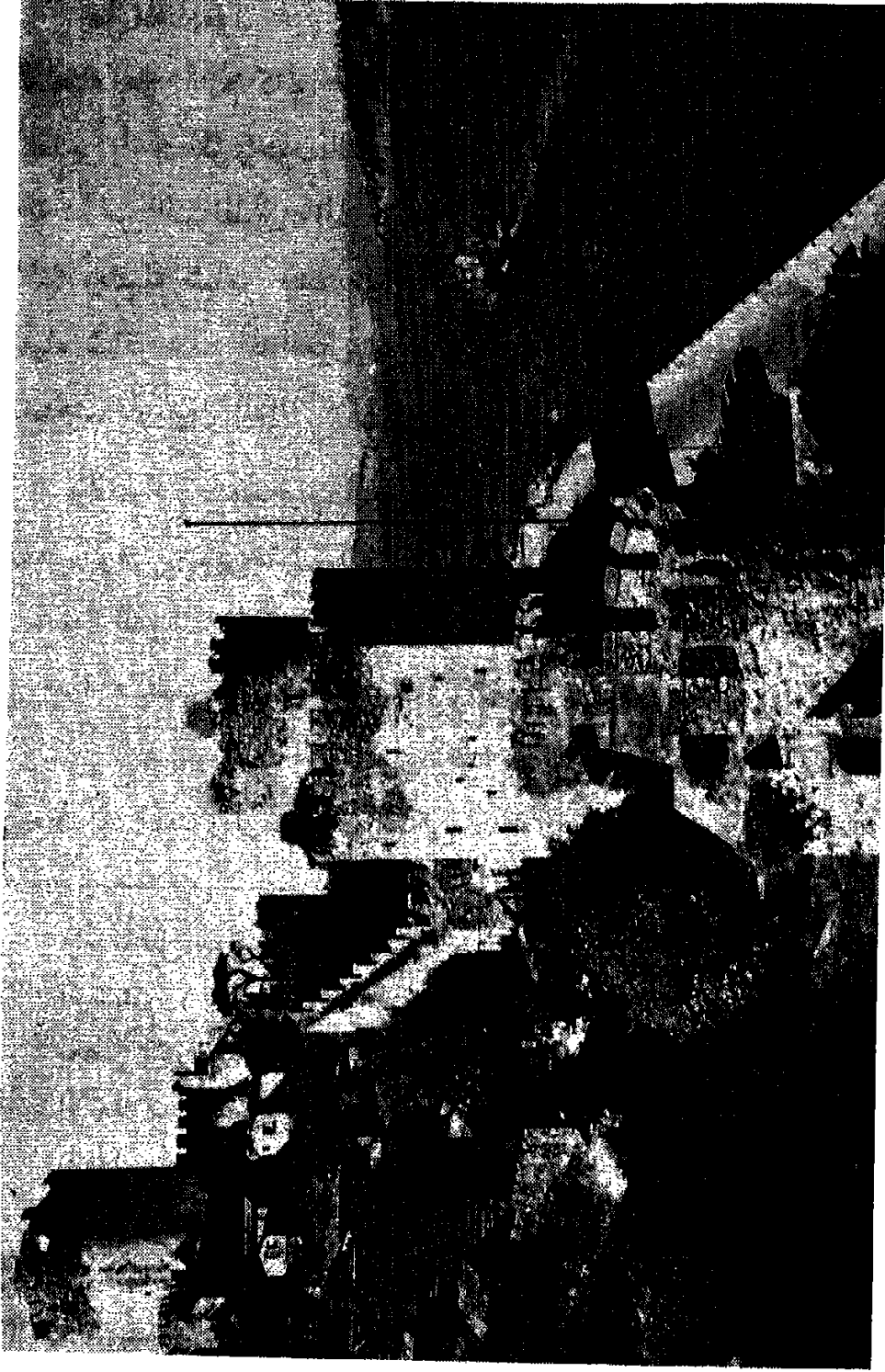
- روملي حصار ، أو حصن روملي ، من بناء السلطان محمد الفاتح في سنة ١٤٥٢ م .