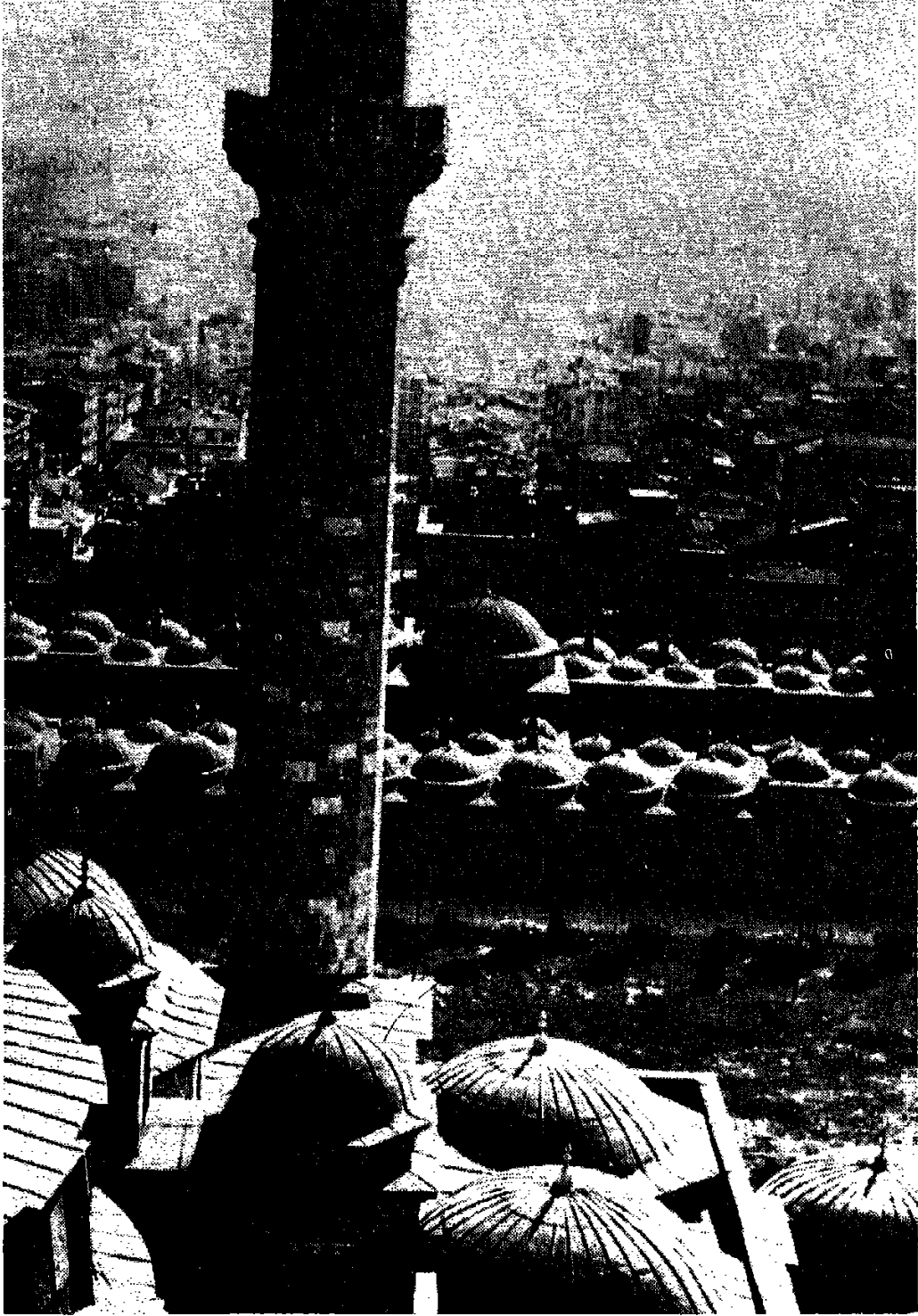
- مدارس الصحن الثمانية ، مع منارة جامع الفاتح وخلفها مباني استنبول .