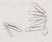
مشابك من الحديد