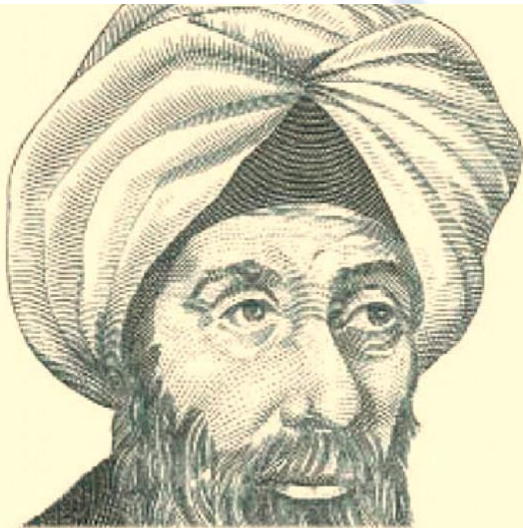
الحسن ابن الهيثم