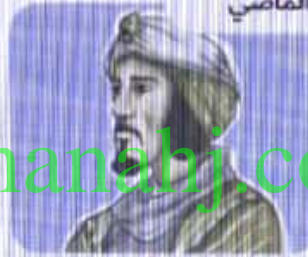
المهلب بن أبي صفرة