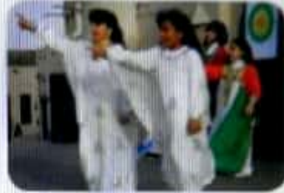
التراث غير المادي