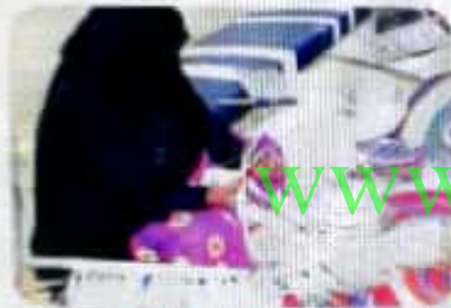
التراث غير المادي