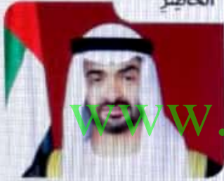
الشيخ محمد بن زايد حفظه الله