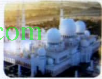
مسجد الشيخ زايد