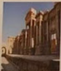
منطقة تدمر الأثرية

14 تسمى المعابد المدرجة في بلاد الرافدين ذات الشكل التصاعدي رأسي وينتهي في أعلاه بمكان الإله أو غرفة الإله: