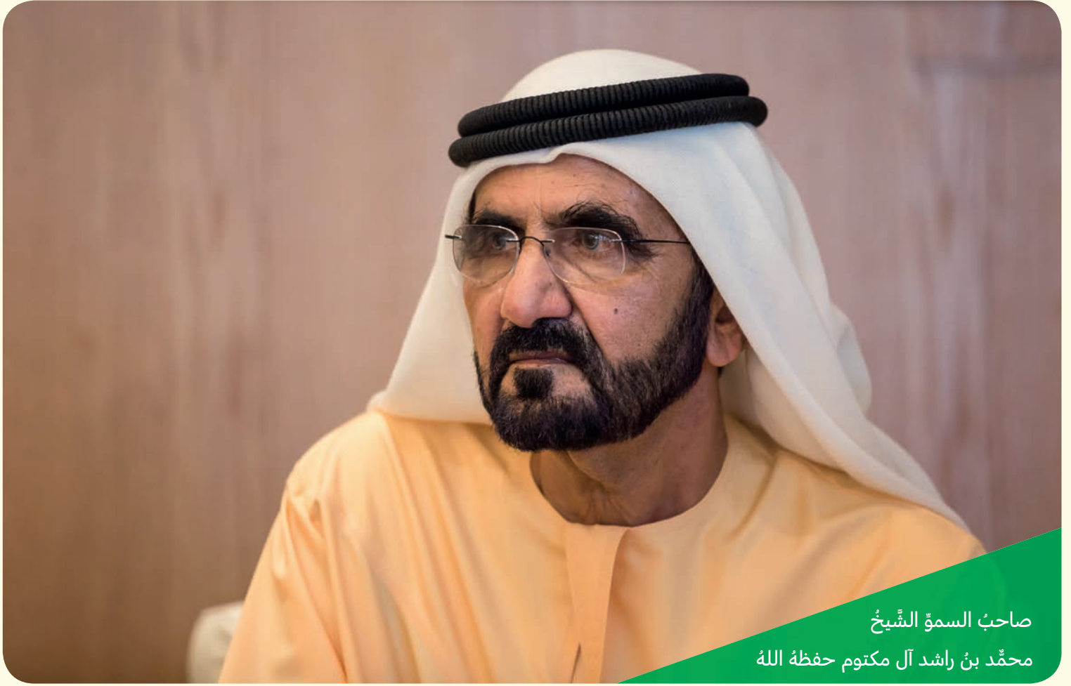
صاحب السمو الشيخ محمد بن راشد آل مكتوم حفظه الله

أ. ما القيمة في هذه الرسالة التي تحكم علاقة الدولة بالناس، وما أهميتها لمجتمع دولة الإمارات؟