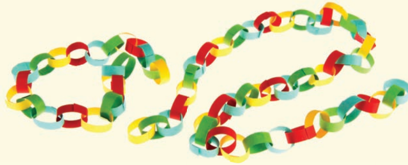
سلسلة من الورق الملون