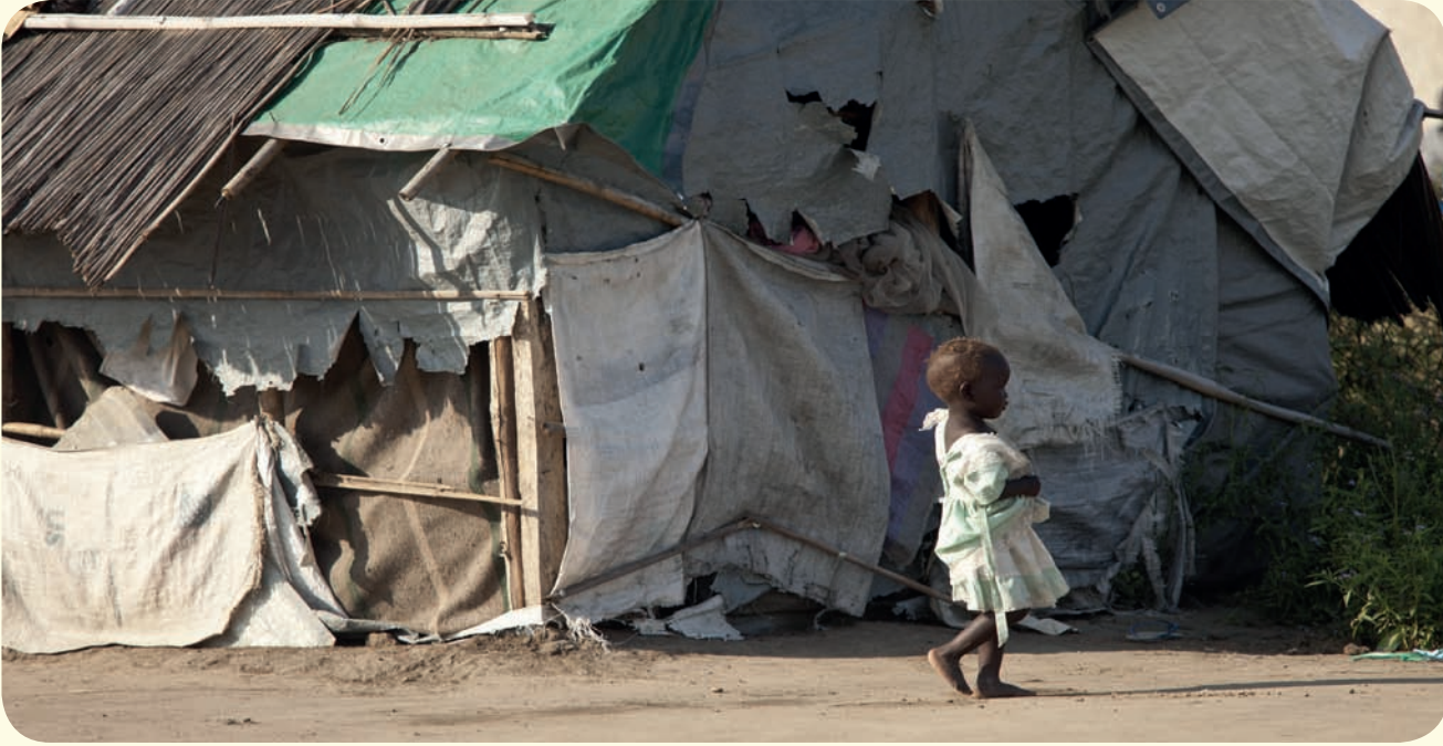
مخيم للاجئين في السودان

تتقل هذه البعثات في جميع أنحاء جنوب السودان، وهذا تذكير آخر بضرورة السماح لجميع العاملين في المجال الإنساني في البلد بالوصول إلى المحتاجين بصورة كاملة وآمنة ومن دون عوائق.