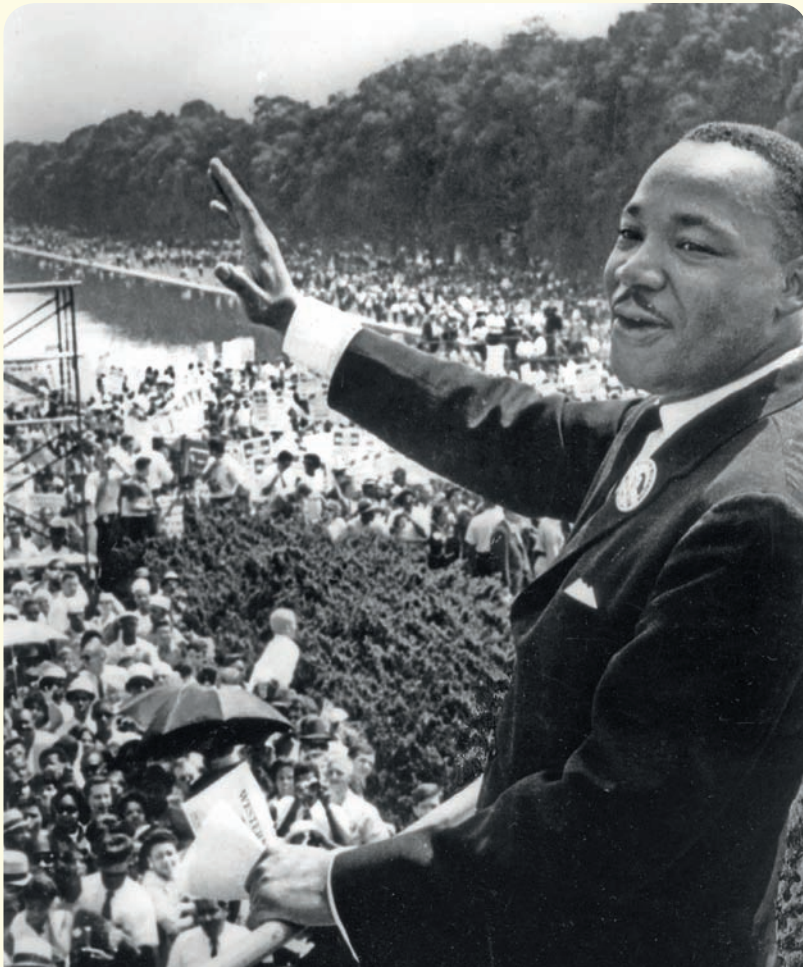
مارتن لوثر كينغ في واشنطن أثناء خطابه "لديّ حلم"

يحتفلُ بيوم مارتن لوثر كينغ في الثالث من شهر يناير كلّ عام، وهو يوم عطلة فيدرالية في الولايات المتحدة الأميركية يُكرّم فيه إرث كينغ ويُدعى فيه المواطنون للمشاركة في الخدمة التطوعية في مجتمعاتهم. وقد أنشئ معهد مارتن لوثر كينغ للأبحاث والتعليم في جامعة ستانفورد في ولاية كاليفورنيا الأميركية، وهو مقرّ يضم جميع خطابات كينغ ويقوم بالربط بين الناشطين