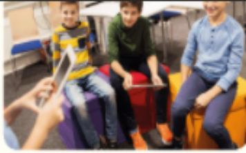
مسرحية قصيرة من إبداعك.