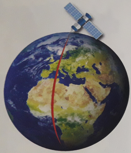
[ مع غرينيسش ]

المطلوب - ألاحظ الصور الآتية، وأحدد مسارات أقمار الاستشعار عن بعد.