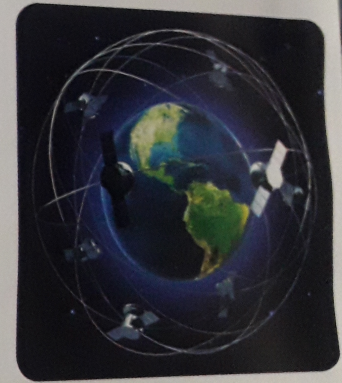
[ مسارات مختلفة ]