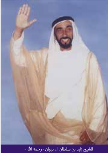
الشيخ زايد بن سلطان آل نهيان - رحمه الله -