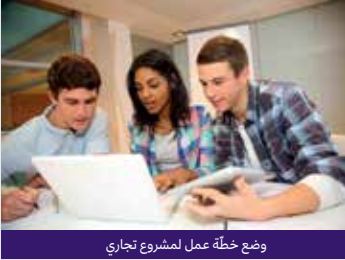
وضع خطة عمل لمشروع تجاري

تذكر أنك كُلفت من قبل شخص ما بأن تتخيل نفسك مستثمرًا وأنتجت لك الفرصة لتطوير شركة ناشئة جديدة. والآن الفرصة متاحة لك للمضي قدمًا في تلك الخطوة!