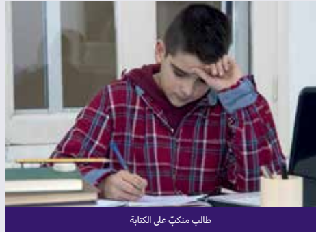
طالب منكب على الكتابة

اكتب فقرة من عشرة أسطر عن اعتباراتك حول مشروعك الناشئ.