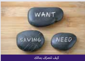
كيف تتصرف بمالك