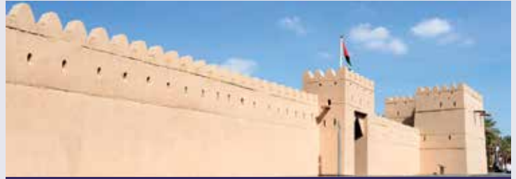
قصر المويجعي في مدينة العين، دولة الإمارات العربية المتحدة

ج. هل ينبغي أن يمتلك كل الناس الهدف نفسه؟