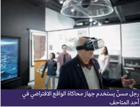
رجل مسنّ يستخدم جهاز محاكاة الواقع الافتراضي في أحد المتاحف

إن أحد الحلول لمشكلة صون تراثنا المادي مع الحفاظ على المواقع التاريخية والقطع الأثرية آمنة ربما يتمثل في إطار ما يعرف بالمتحف «الافتراضي». وسواء أكان هذا هو الطريق المتبقي للمضي قدماً أم لا، فإن التقدم التكنولوجي يؤثر حتماً في الطريقة التي نستكشف بها التراث.