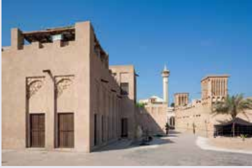
فن العمارة الإماراتي