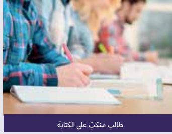
طالب منكب على الكتابة

المال جزء ضروري من الاقتصاد العالمي، والعديد من الناس لديهم مشاعر قوية حيال المال.