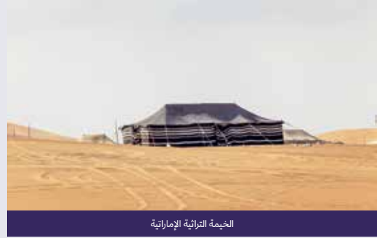
الخيمة التراثية الإماراتية

إن كلمة تراث مشتقة من الفعل "وَرثَ" ويعني انتقال ملكية شيء ما من مالك إلى آخر. ولكل أمة نوعان من التراث: أولهما، التراث المادي الذي يشمل النصب التذكارية التاريخية، والمباني والمواقع الأثرية، والقطع الأثرية مثل اللوحات والرسومات والمطبوعات وصور الفسيفساء والتماثيل؛ وثانيهما، التراث المعنوي ويشمل اللغة والقيم والتقاليد والتاريخ الشفوي. المأكولات والملابس وأشكال المنازل والمهارات التقليدية والحرف والتقنيات والاحتفالات الدينية وكل ما يدل على الإبداع الإنساني والتعبير مثل سرد القصص والموسيقى والرقص. ونحن نعرف أن ثقافة مجموعة أو شعب ما هي تراكم أفكاره وعاداته وتقاليده وإنجازاته. هذه الأمثلة "المعنوية" على تراثنا الثقافي هي التي تمنح الأمم هويتها الثقافية المتميزة. وفي حين هناك ثقافة المقهى المعاصر النابض بالحياة والتي ترجع إلى أواخر القرن التاسع عشر، بينما تمتلك الصين تقليدًا رائدًا يتمثل في مسرحيات خيال الظل التي اشتهرت لأول مرة أثناء حكم سلالة سونغ الشمالية (960 - 1127). كذلك تُعدّ عادات صناعة السجاد والتسيج في أذربيجان، وتقليد الصّقارة في دولة الإمارات العربية المتحدة، وحتى النظام الغذائي الصحي لدول البحر الأبيض المتوسط أمثلة على التراث الثقافي المعنوي. على الرغم من التغير والتطور الثقافي المستمرين، إلا أنّ من المهم أن نتعرّف إلى تراثنا فهو الذي يخبرنا من نحن ومن أين جئنا. فاللغة التي تحدثها، ووصفة الطعام الذي تطهوه والدتك، والتي تعلمتها من جدّتها، والقصص التي رواها لك والدك في طفولتك... كلها تُعدّ جزءًا من تراثك.