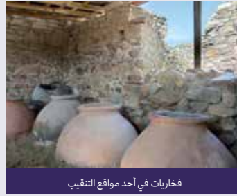
فخاريات في أحد مواقع التنقيب

يُعد التنقيب عن الآثار إحدى الطرق التي تمكّننا من اكتشاف المزيد عن نمط الحياة والتقاليد المرتبطة بسكان موقع قديم وعلاقتهم بالجغرافيا الطبيعية للمنطقة. هذا المقتطف مأخوذ من يوميات عالمة آثار كانت تعمل في موقع مصري في الأردن، صيف عام 1999. اقرأ يومياتها وأجب عن الأسئلة التالية.