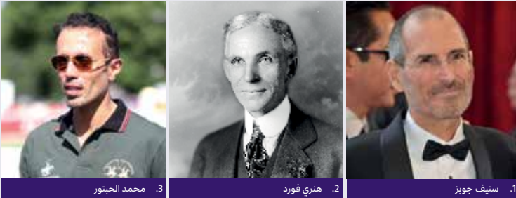
1. ستيف جوبز

حدّد هوية كل من الأشخاص المبيّنين في الصور. ما الأشياء المشتركة بينهم؟ اذكر مساهمة كل منهم في العالم الذي نعيش فيه اليوم.