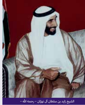
الشيخ زايد بن سلطان آل نهيان - رحمه الله -

"مهما أقمنا من مبان ومنشآت ومدارس ومستشفيات، ومهما مددنا من جسور وأقمنا من زينات، فإنّ ذلك كله يظلّ كياناً مادياً لا روح فيه. إنّ روح ذلك كله هو الإنسان: الإنسان القادر بفكره وإمكانياته".