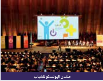
منتدى اليونسكو للشباب

إنّ عملية منتدى الشباب جزء أساسي من برنامج اليونسكو للشباب. فمُنذ إنطلاقه في العام 1999 قدّم المنتدى فرصة مبتكرة ومستمرة للشباب للعمل والتحاوّر مع اليونسكو لتشكيل نهج المنظمة وتوجيهه والتعبير عن مخاوفهم وأفكارهم للدول الأعضاء.