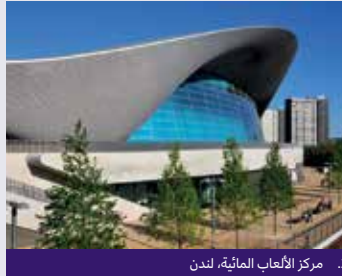
2. مركز الألعاب المائية، لندن

أ. واجهت زها حديد تحديات تختلف عن التحديات التي واجهها جاك ما وإيلون ماسك. هل يمكنك ذكر هذه التحديات؟