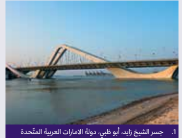
1. جسر الشيخ زايد، أبوظبي، دولة الامارات العربية المتحدّة