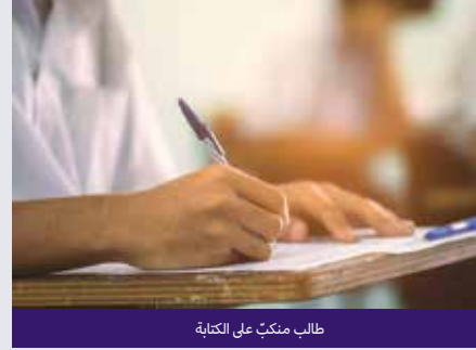
طالب منكبّ على الكتابة

بما أنك قد أتيت لك الفرصة لتخيل جميع الجهود التي تُبذل من أجل تأسيس شركة ناشئة، فكّر في الدروس المستفادة. هل تمتلك السمات الشخصية اللازمة لتأسيس شركة ناشئة؟ هل تتمتع بالمهارات المالية؟ هل ستكون قادرًا على مواجهة الضغوط والتحديات؟