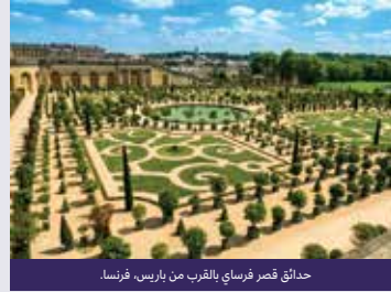
حدائق قصر فرساي بالقرب من باريس، فرنسا.