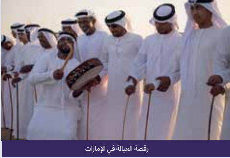
رقصة العيالة في الإمارات

بالتالي فإن رقصة العيالة، عدا عن أنها تعدّ تعبيرًا عن الشجاعة والبطولة والقوة والفروسية، تعبّر كذلك عن وجدان القبيلة وتلاحم أفرادها وتكاتفهم في مواجهة القبائل الأخرى.