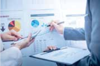
اكتساب الخبرة بالشؤون المالية

في أعقاب الأزمة المالية العالمية، وضعت مؤسسة الإمارات برنامج "أصرف صح" الذي يهدف إلى تثقيف الشباب الإماراتي حول الأمور المالية وتزويدهم بمعلومات أولية ضرورية لإدارة أموالهم. إنه موضوع الساعة في الإمارات مع ارتفاع مستويات الديون في السنوات الأخيرة، إذ تشير الإحصاءات إلى أن عددًا كبيرًا ممن هم دون سن 30 مدينون. لكن الدين بحد ذاته ليس أمرًا سيئًا بالضرورة، بل كثرة الديون هي المشكلة. إن لم تحسب جيدًا المبلغ الذي يمكنك استدانته فقد تجد نفسك في وضع مالي عسير. لقد ربط البعض هذه الظاهرة بانتشار وسائل التواصل الاجتماعي وثقافة "اشتر الآن" والتي تدفع الشباب إلى الاستفادة من بطاقات الائتمان والقروض المعروضة عليهم من المصارف.