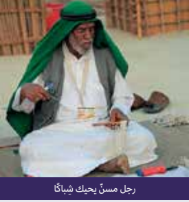
رجل مسنّ يحك شبكاً

تعد قرية التراث طريقة من الطرق التي تحافظ بها الحكومات في دولة الإمارات العربية المتحدة على التراث وتحقق به. توفر هذه القرى الوهمية مساحة تمكن الزوار من تجربة التراث والثقافة التقليدية لدولة الإمارات العربية المتحدة من خلال تصوير أنماط الحياة التقليدية. وتتضمن هذا كيفية تفاعل أجدادنا مع البيئة الطبيعية وأشكال التراث المادي وغير المادي.