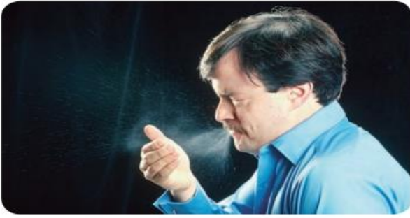
الاتصال غير المباشر عبر الهواء