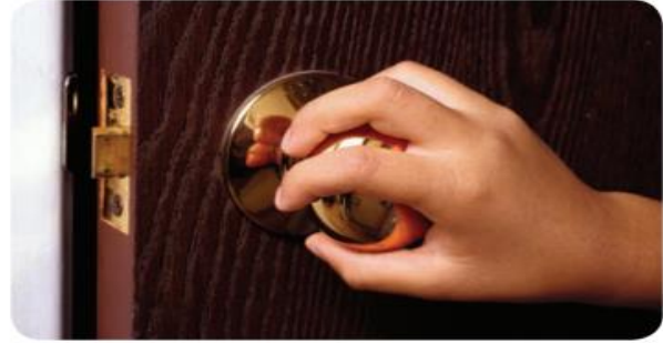
الاتصال غير المباشر بواسطة الأشياء