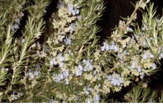
Rosmarinus officinalis 55 حصليان، إكليل الجبل