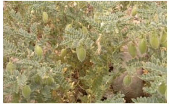
Cicer arietinum 58 حمص