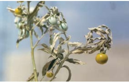
Solanum nigrum 107 سموة، عنب الديق