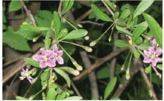
Lycium europaeum عرقند 127