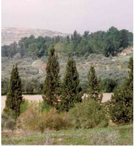
Cupressus sempervirens 101 سرو دائم الاخضرار