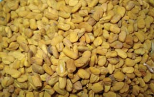
Trigonella berythea ( T. foenum-graecum ) 57 حلبة