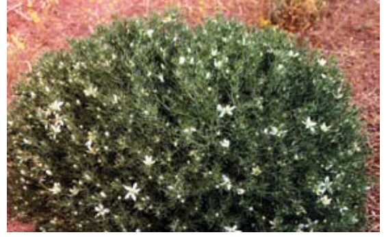
Peganum harmala 54 حرمل، حرمليان