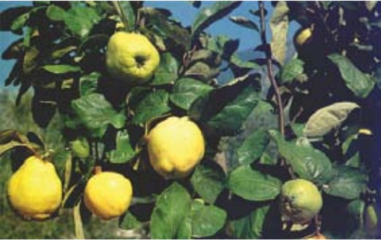
Cydonia vulgaris 103 سفرجل