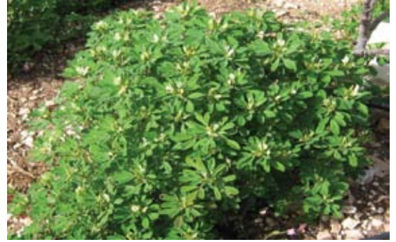
Trigonella berythea ( T. foenum-graecum ) 56 حلبة