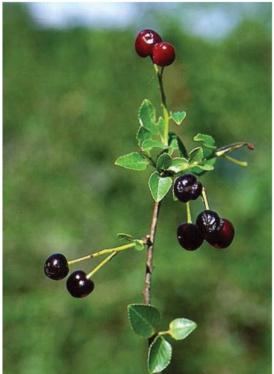
Prunus mahaleb ( Cerasus mahaleb )