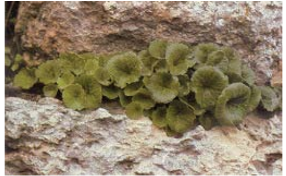
Umbilicus intermedius عصا الراعي 129