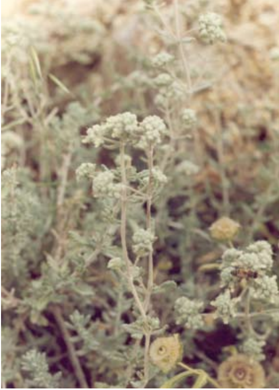
Teucrium capitatum (T. polium)