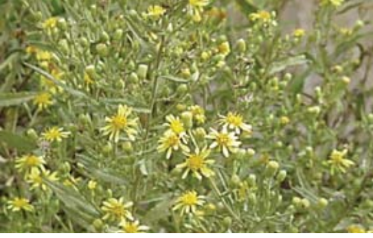
Dittrichia viscosa (Inula viscosa) عرق الطيون 126