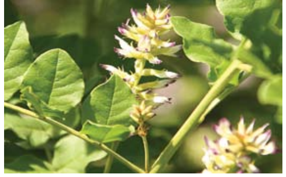
Glycyrrhiza glabra عرق السوس 125