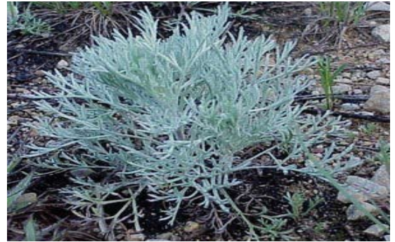
Artemisia inculata (A. herba-alba) 117 شيح