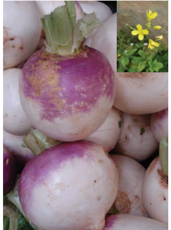
Brassica rapa var. rapa