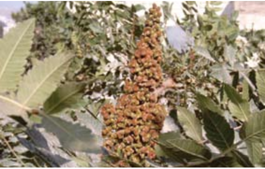
Rhus coriaria 105 سماق