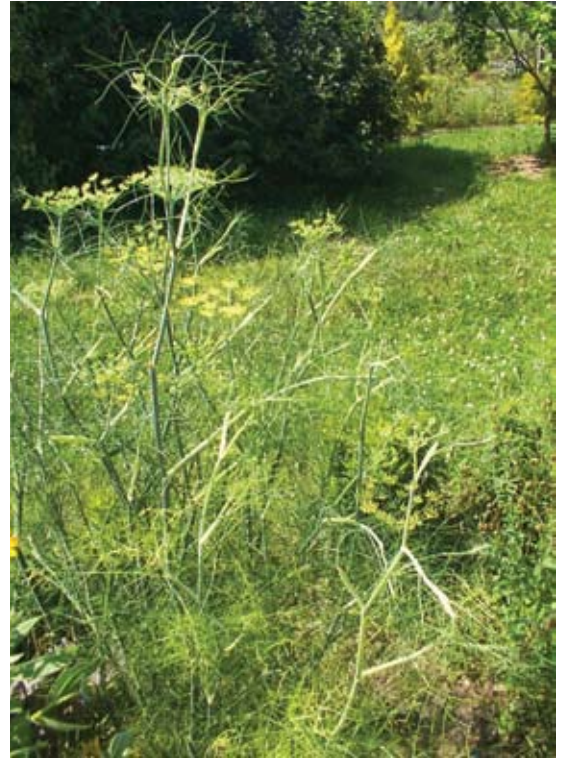
Foeniculum vulgare 115 شومر