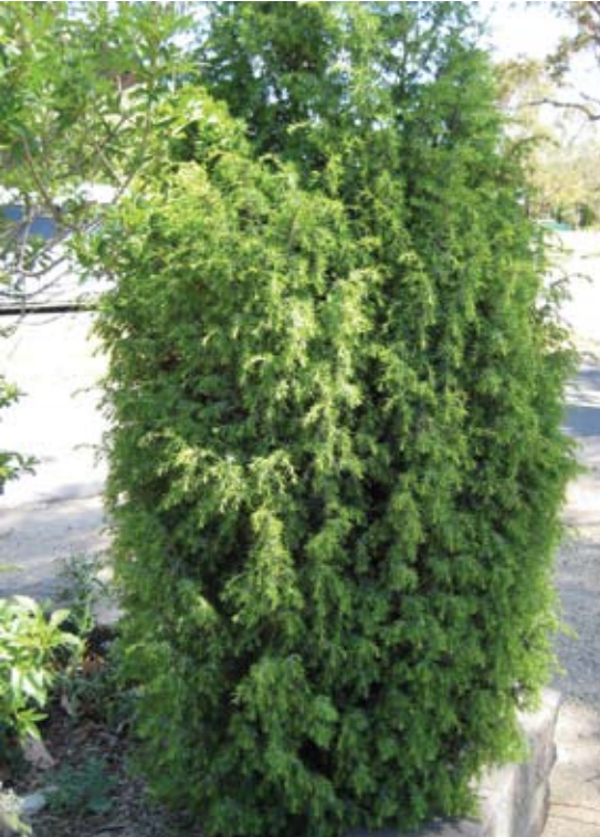
Thuja occidentalis عصف 131