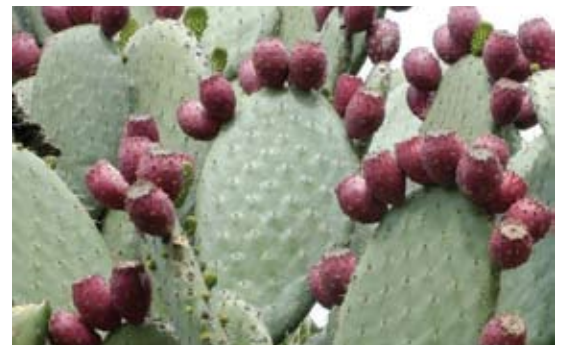
Opuntia ficus-indica 118 صبر