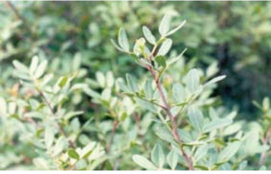
Pistacia lentiscus 102 سريس، مصطكي