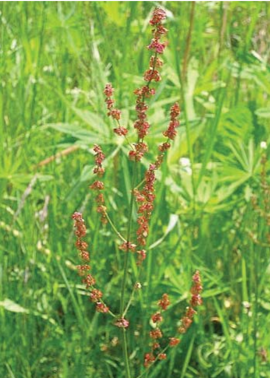
Rumex acetosa 60 حميض