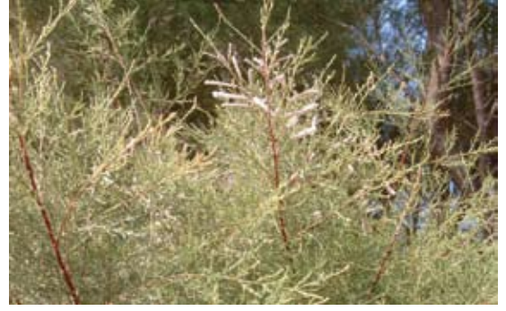
Tamarix Aphylla (T. articulata)