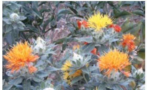
Carthamus tinctorius عصفر 130