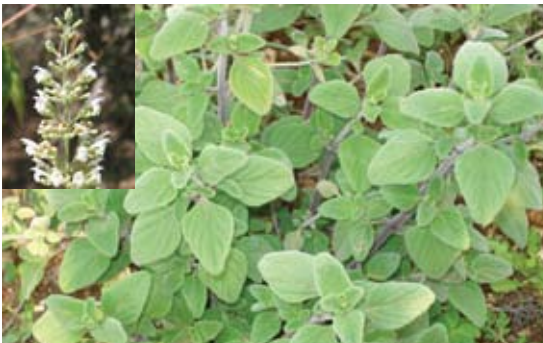
Micromeria fruticosa Druce