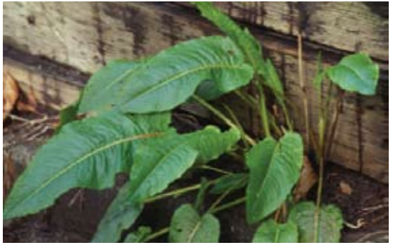
Rumex patientia 104 سلق (بري)