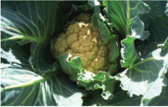
Brassica oleracea var. botrytis