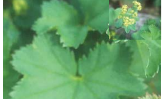
Aphanes vulgaris (Alchemilla vulgaris) 79 رجل الأسد