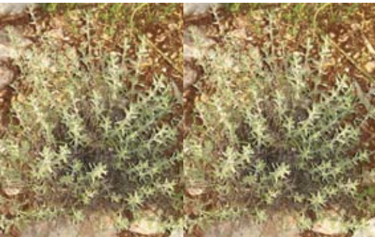
Varthemia iphionoides ( Chiladenus iphionoides ) 161 كتيلة