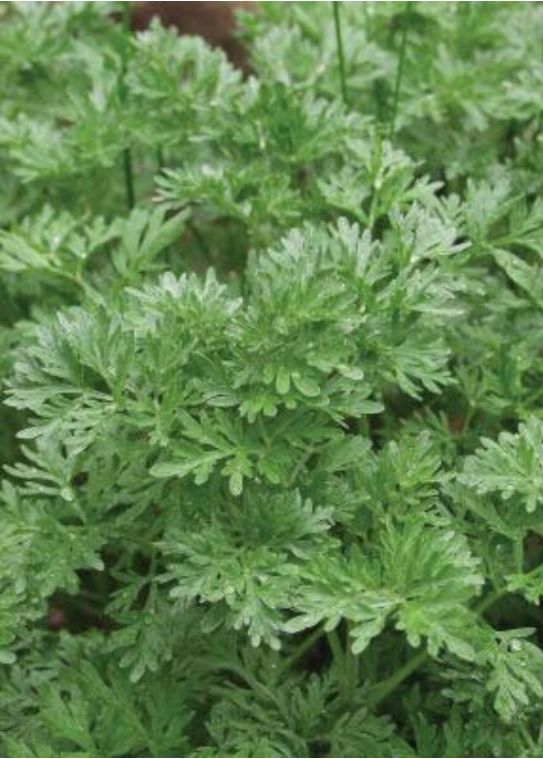
Artemisia absinthium 116 شيبه النبي، أفنستين