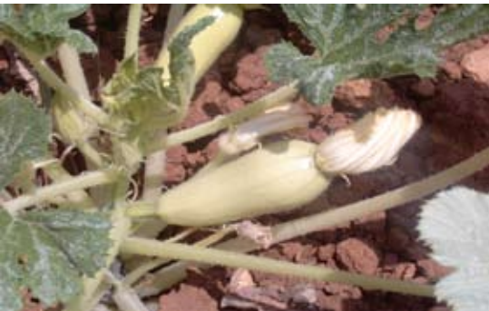
Cucurbita pepo convar. giromontiina