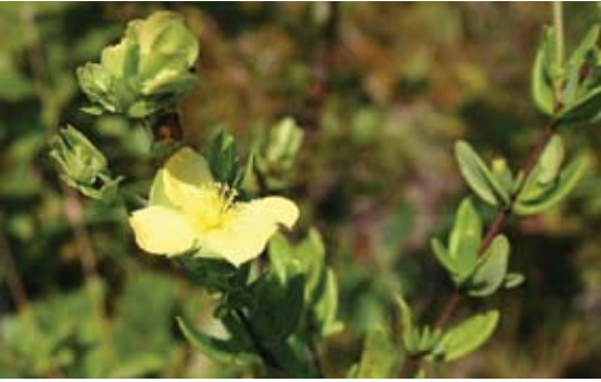
Hypericum languinosum عشبة الجرح 128