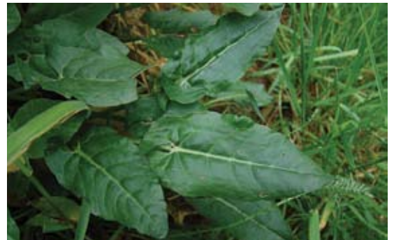
Rumex acetosa 59 حميض