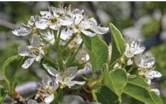
Prunus mahaleb ( Cerasus mahaleb )