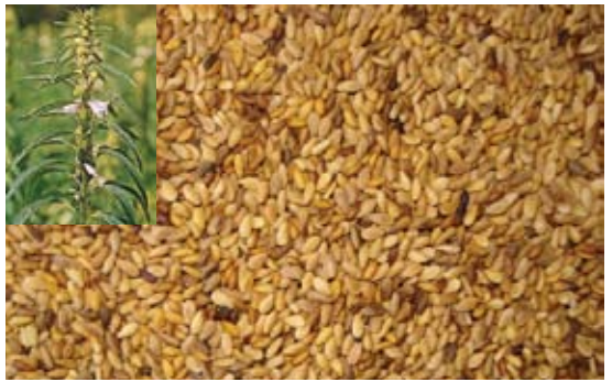
Sesamum indicum 106 سمسم