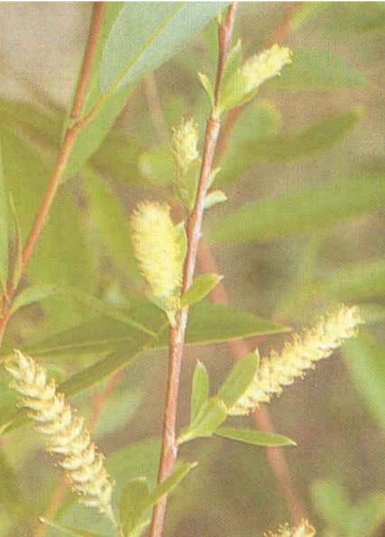
Salix acmophylla 119 صفصاف