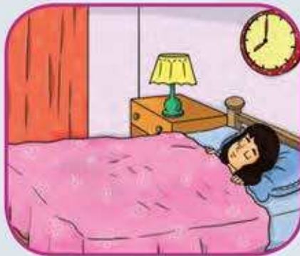
النوم مبكرا مفيد