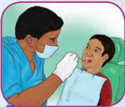
الأهتمام بالأسنان ضروري

اَكْتُبْ جُمْلَةً تُعَبِّرُ عَنِ قِيَمَةِ الْإِعْتِنَاءِ بِالصَّحَّةِ.