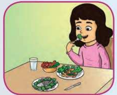
الطعام الطازج صحي .