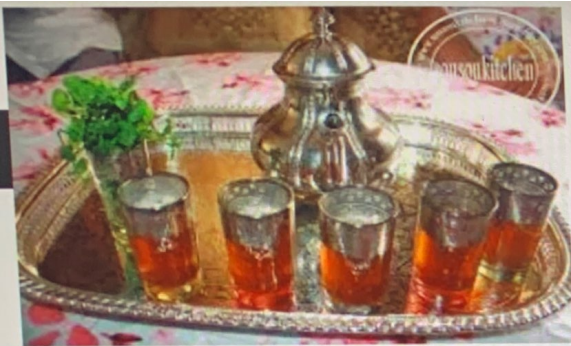
شاي مغربي ( من المغرب )