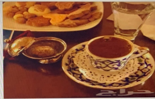
قهوة تركية (من تركيا )