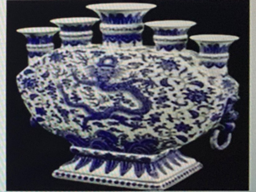
خزف صيني ( من الصين )