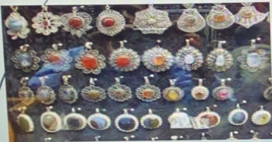
عقيق يمني ( من اليمن )