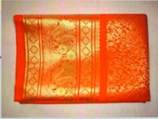
حرير هندي ( من الهند )

1 تخيل أنك زرت القرية العالمية مع بعض أصدقائك ، وأنك حين عدت إلى البيت ، أخذت تخبر والديك عن بعض مشاهداتك ، وهذه صور لبعض ما التقطته هناك . 2 أكمل الفراغات بوضع الصفة المناسبة لكل قطعة من القطع الموضحة في الصور :