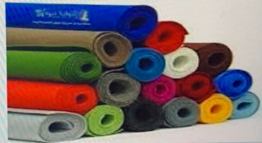
قطن مصري ( من مصر )