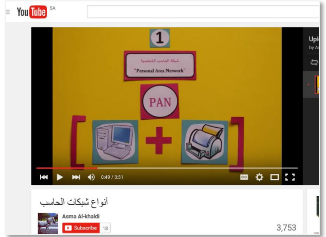
تصميم مقاطع فيديو و نشره للآخرين