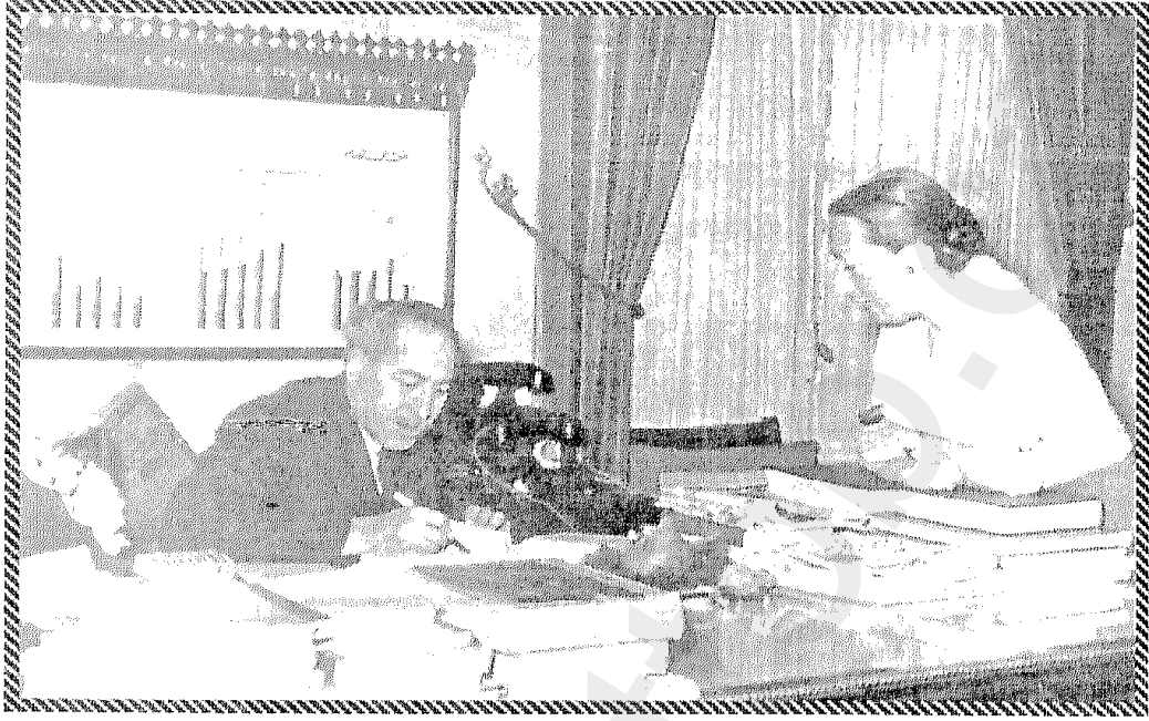
توفيق الحكيم في مكتبه