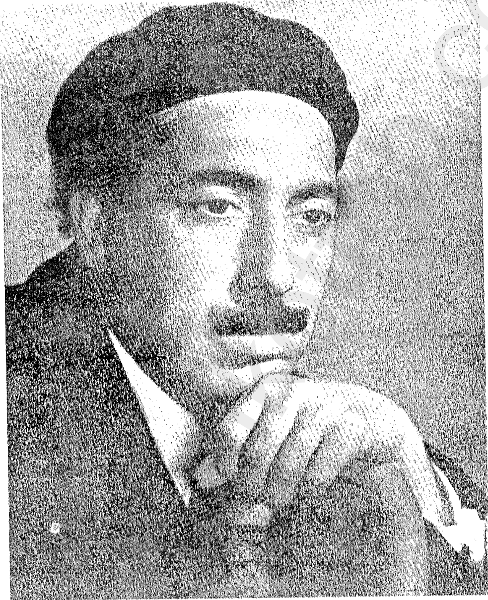
توفيق الحكيم ١٩٤٣