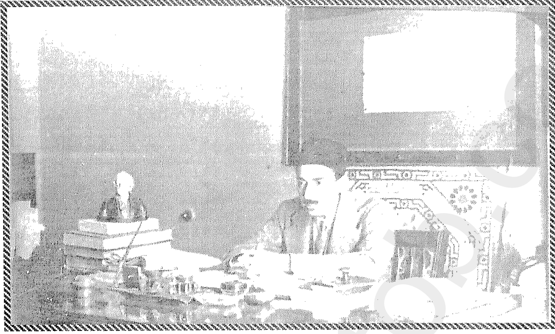
توفيق الحكيم فى شبابه