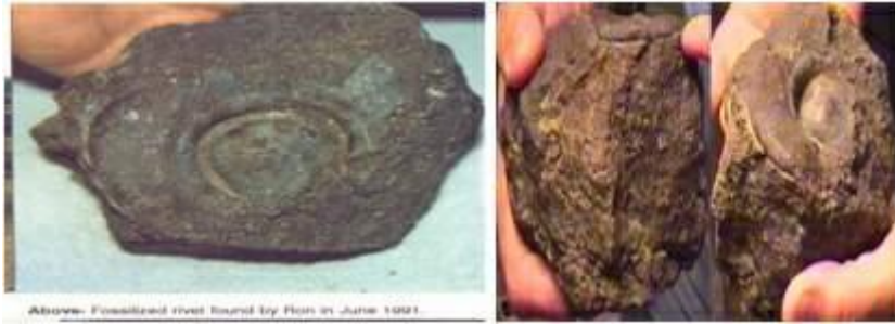
الدرس المعدنية وقد تحولت إلى حفريات

وثانياً: هل كان طوفان نوح محلياً أم عالمياً ؟ : فيما يتعلق بهذا الأمر فإن ما ذكره القرآن الكريم لا يُثير أي إشكال ولا يتعارض مع حقائق العلم والتاريخ، لكن الكتاب المقدس تورط وأخطأ عندما حدد للطوفان الزمن الذي حدث فيه من جهة، وذكر أنه كان عالمياً شمل كل الأرض من جهة ثانية، وحدد ارتفاع المياه من جهة ثالثة. وتفصيل ذلك فيما يأتي: