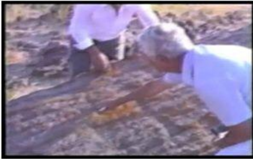
لوح خشبي آخر متحجر من ألواح السفينة 190