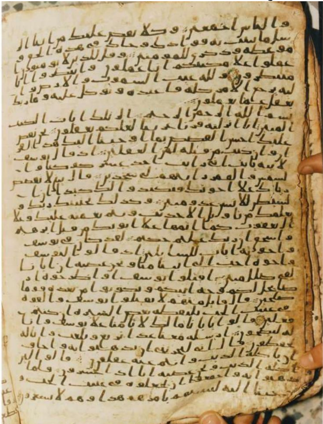
اللوحة رقم: 03 من المخطوط- القرن الأول الهجري