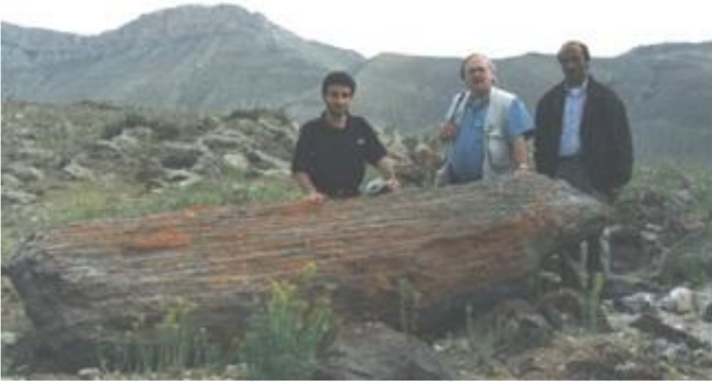
لوح خشبي متحجر آخر من ألواح السفينة يلاحظ أنه على هيئة مسطحة غير أسطوانية كجذوع الأشجار ، فهو كما وصف القرآن 189