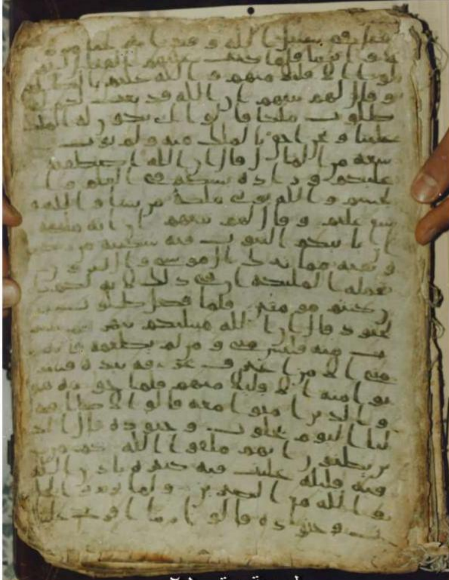
اللوحة رقم: 01 من المخطوط- القرن الأول الهجري-

في سقف الجامع . فالثعابين لم تفسد المصاحف وإنما حمتها وحرستها 20 ، فسبحان الذي صخرها لحفظ كتابه !!!! . وفيما يأتي شواهد من تلك المخطوطات القرآنية من القرن الأول الهجري مقارنة بالمصحف الموجود عندنا اليوم 21 :