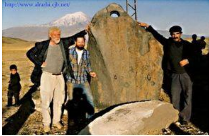
إحدى مراسي السفينة