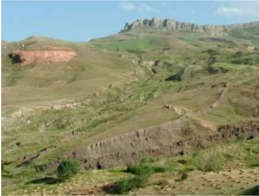
صورة للسفينة المتحجرة على جبل الجودي في تركيا 183

أولاً: فبالنسبة للسفينة- الفلك- في القرآن الكريم، فقد تحدثت عنها في مواضع كثيرة، ووصف جانباً من خصائصها ومكوناتها تضمنت إشارات إعجازية تشهد للقرآن بالإعجاز وانه وحي إلهي . منها أنه تكلم عن السفينة وأشار إلى أنها ستبقى محفوظة آية للناس، لقوله تعالى: (( وَحَمَلْنَاهُ عَلَىٰ ذَاتِ الْأَوَّاحِ وَدُسُرٍ تَجْرِي بِأَعْيُنِنَا جَزَاءً لِمَنْ كَانَ كُفِرًا وَلَقَدْ تَرَكْنَاهَا آيَةً فَهَلْ مِنْ مُدَكِّرٍ )) (القمر: 13-14)). ومنها أنها رست على جبل الجودي ، قال تعالى : (( وَقِيلَ يَا أَرْضُ ابْلَعِي مَاءَكِ وَيَا سَّمَاءِ أَقْلِعِي وَغِيضَ الْمَاءِ وَقُضِيَ الْأَمْرُ وَاسْتَوَتْ عَلَىٰ الْجُودِيِّ وَقِيلَ بُعْدًا لِلْقَوْمِ الظَّالِمِينَ )) (هود : 44) . وهذان الأمران تم اكتشافهما حديثاً، فقد اكتشفت السفينة على جبل الجودي بتركيا كما هو مبين في الصورة الآتية، وقد وثق هذا الحقائق فيلم وثائقي أنتج سنة 1997 م، بعنوان: اكتشاف سفينة نوح 182 :