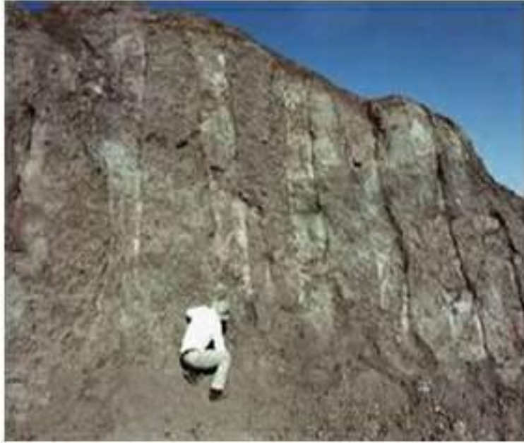
آثار الألواح الخشبية في طابع السفينة بالجودي

ومنها أيضاً أن القرآن الكريم ذكر أن السفينة كانت مصنوعة من ألواح ودُسر - مسامير - ، فهي لم تصنع من أنصاف جذوع الأشجار مثلاً، وإنما من ألواح، وهذا الذي ثبت في السفينة المكتشفة بألواحها ودُسرها - مساميرها - المتحجرة كما هو مبين في الصور الآتية 188 :