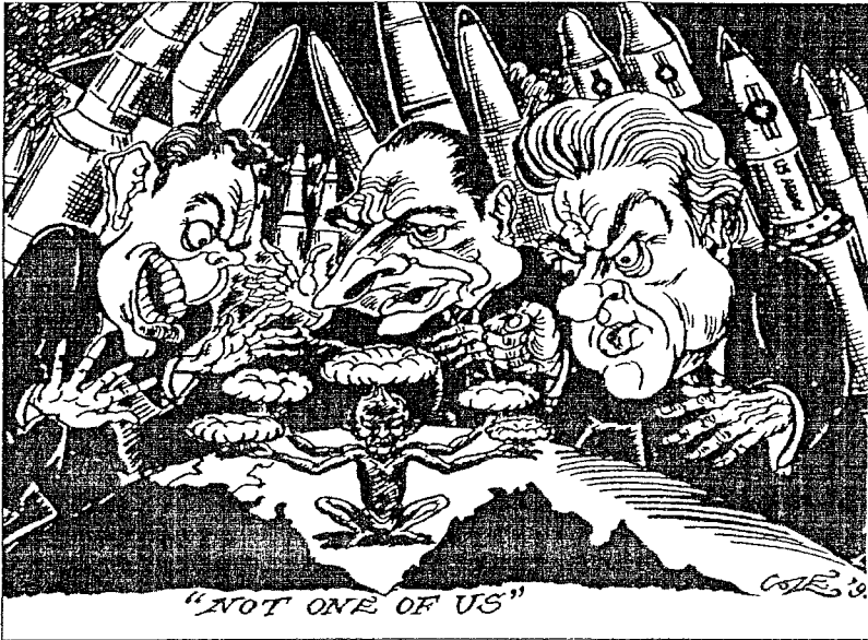
شكل (١٧) "ليس واحدا منا"

لقد شكلت التجارب النووية تفجيرا فى التصورات الجيولوليتيكية بين القوميين الهندوس بالمثل. ففي أعقاب الإعلان عن أن الهند أصبحت "دولة نووية" اقترحت منظمة المجلس الهندوسى العالمى VHP حمل بعض تراب بوخران كترية مقدسة ووضعه فى وعاء مقدس والسير به فى حملة شعبية عبر أرجاء البلاد. كما اقترحت نفس المنظمة بناء معبد للقبلة فى ذات المكان الذى تم فيه إجراء التجارب الخمس.