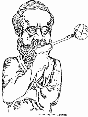
شكل (١٨) رسم وياز لهيروودوت المستخدم فى صفحات عنوان مجلة هيروودوت منذ سبعينيات القرن العشرين.