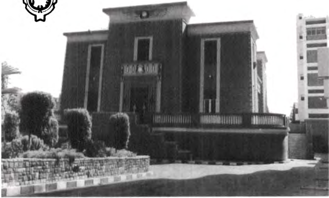
صورة رقم ٢١: تحول قصر عثمان محرم الذي بناه في شارع الهرم على طراز فرعونى إلى مقر لشركة تنمية الصناعات الكيماوية سيد، والصورة للقصر على الكارت الخاص بالشركة.