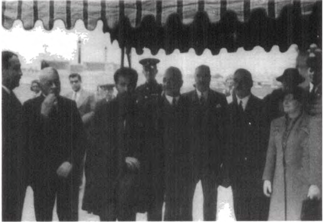
صورة رقم ٩: عثمان محرم مع الاميراطور هيلاسلاسى امبراطور اثيوبيا (الحبشة) أثناء زيارة للاميراطور.