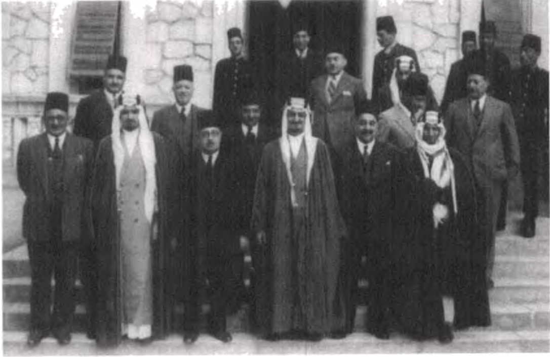
صورة رقم ٧: عثمان محرم مع وفد سعودي برئاسة الامير فيصل ( الملك فيما بعد ) فى صورة تذكارية وقد وقف الرجلان متجاورين فى الصف الاول.