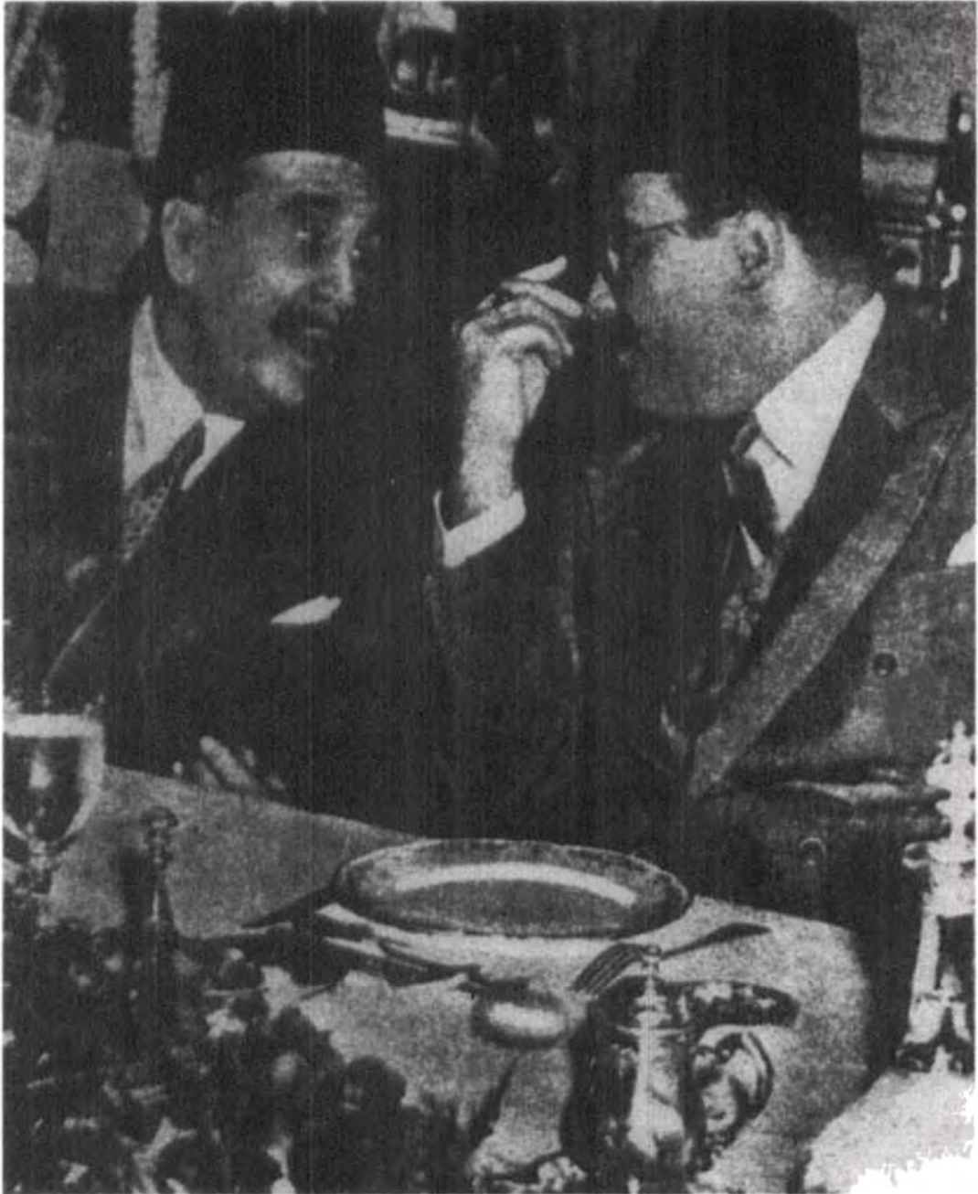
صورة رقم ٤: حديث جانبي على مائدة الطعام في قصر عابدين بين الملك فاروق والمهندس عثمان محرم باشا.