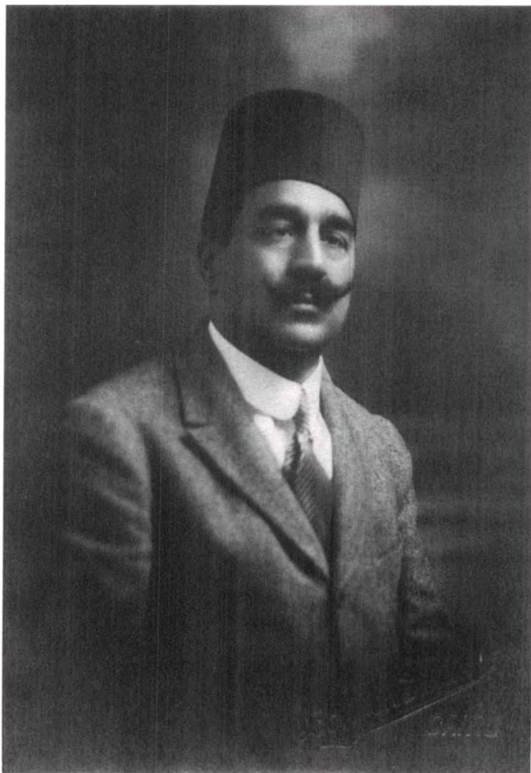
صورة رقم ٢: رسمية لعثمان محرم باشا.