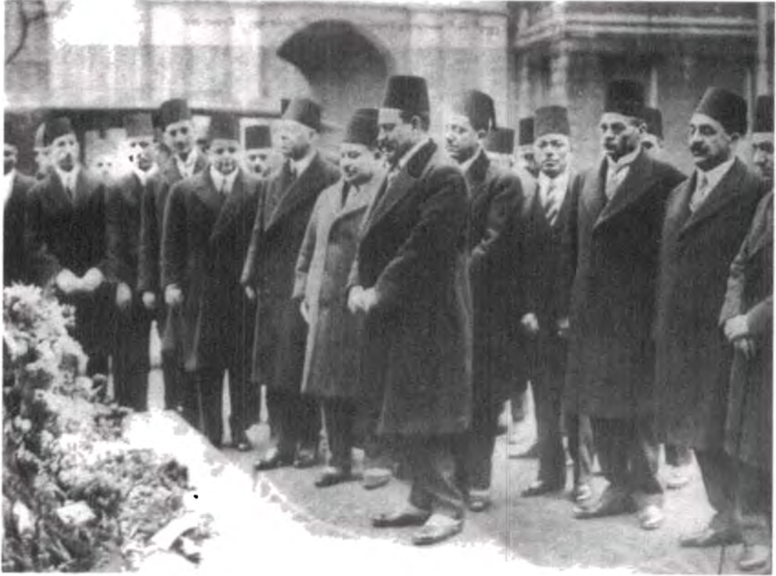
صورة رقم ٦: في لندن وأمام نصب تذكاري وقف كل من مصطفى النحاس وأحمد ماهر ومكرم عبيد وعثمان محرم.