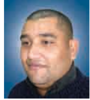
عبدالمعبود بدر باحث إسلامي