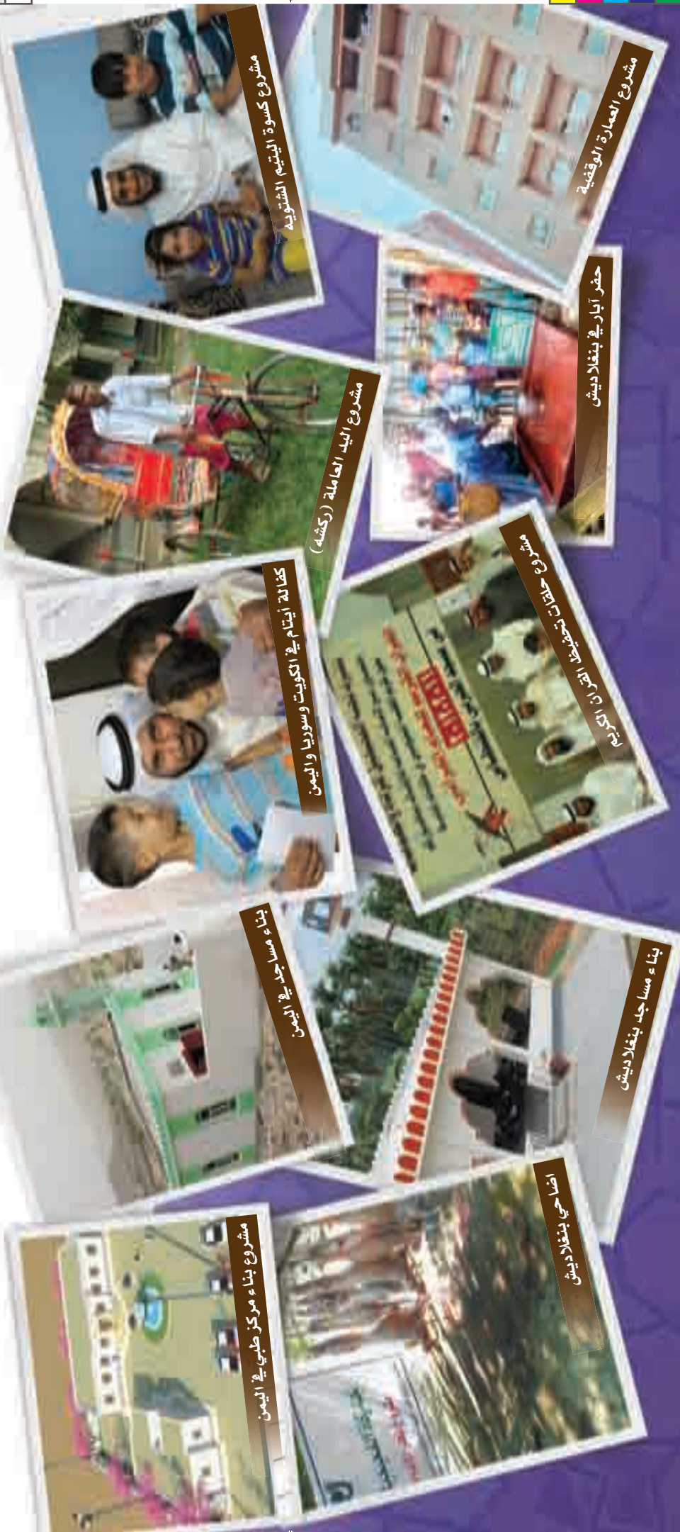
مشروع كسوة اليتيم الشنتوية