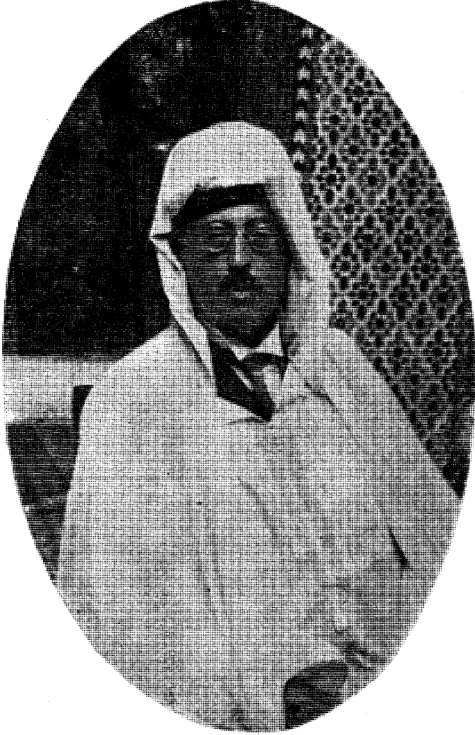
عطوفة الامير شكيب أرسلان