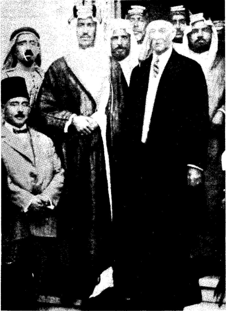
عندما زار الأمير سعود القاهرة في عام ١٩٢٦ - ١٣٤٦ حرص سعد زغلول زعيم الأمة على الظهور الى جانبه والاحتفاء به تحديا للملك فؤاد وتعبيرا عن المشاعر الشعبية نحو النظام السعودي الجديد.