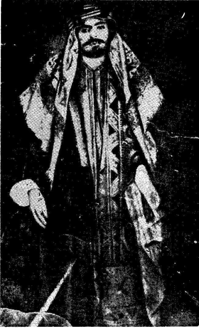
أعظم فارس مغوار أنجبته جزيرة العرب في هذا العصر عبد العزيز بن متمب الرشيد الذي قتل في حربه مع ابن سعود في معركة روضة مهنا الضارية التعليق للقطار والتعجب من عندنا (!!!)