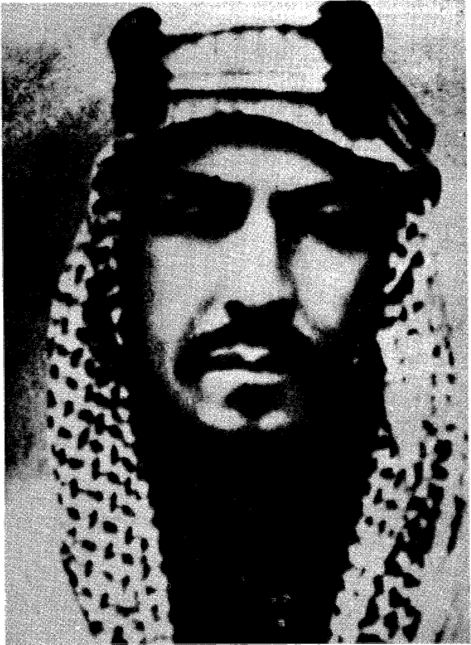
صورة أخذت للملك عبد العزيز عقب إعلانه سلطانا لنجد في أوائل العقد الخامس من عمره .