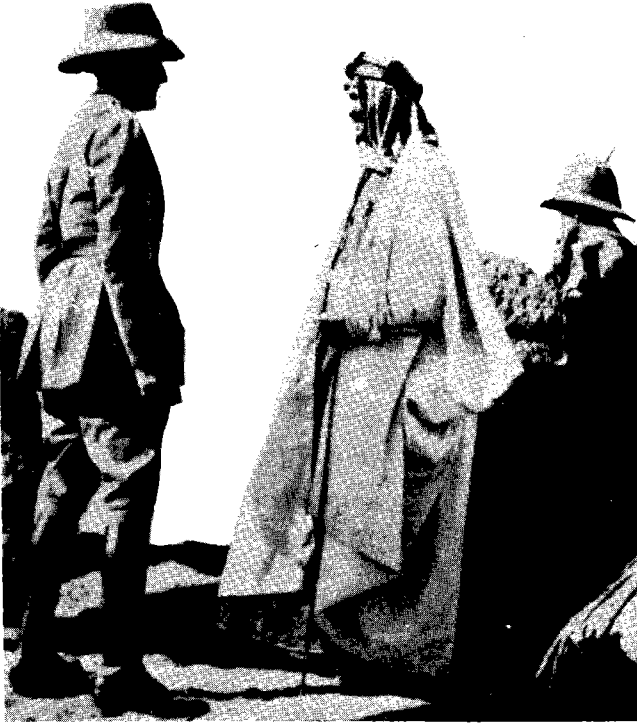
من كوكس الى تشرشل رحلة استغرقت اربعين عاما وحررت ووحدت الجزيرة رغم انف «صداقة» بريطانيا.