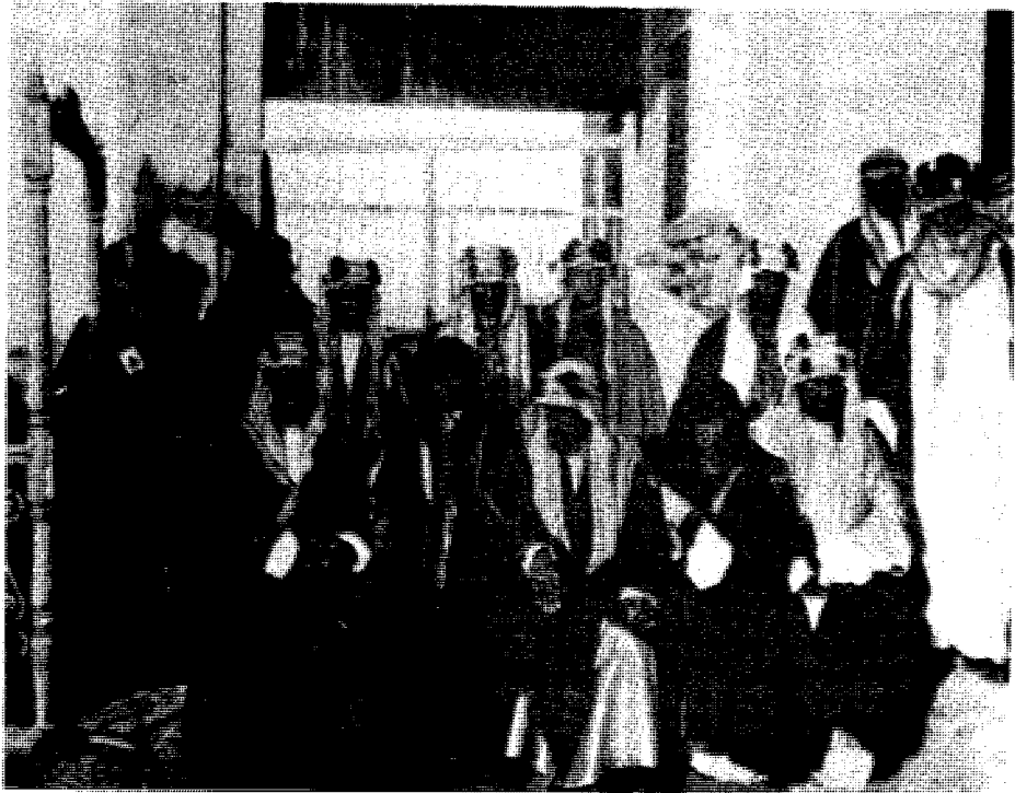
هذه هي الصورة التي استند اليها مؤلف كتاب شكسبير عن لقاء الكويت بين عبد العزيز وشكسبير . وهي من تصوير شكسبير نفسه .