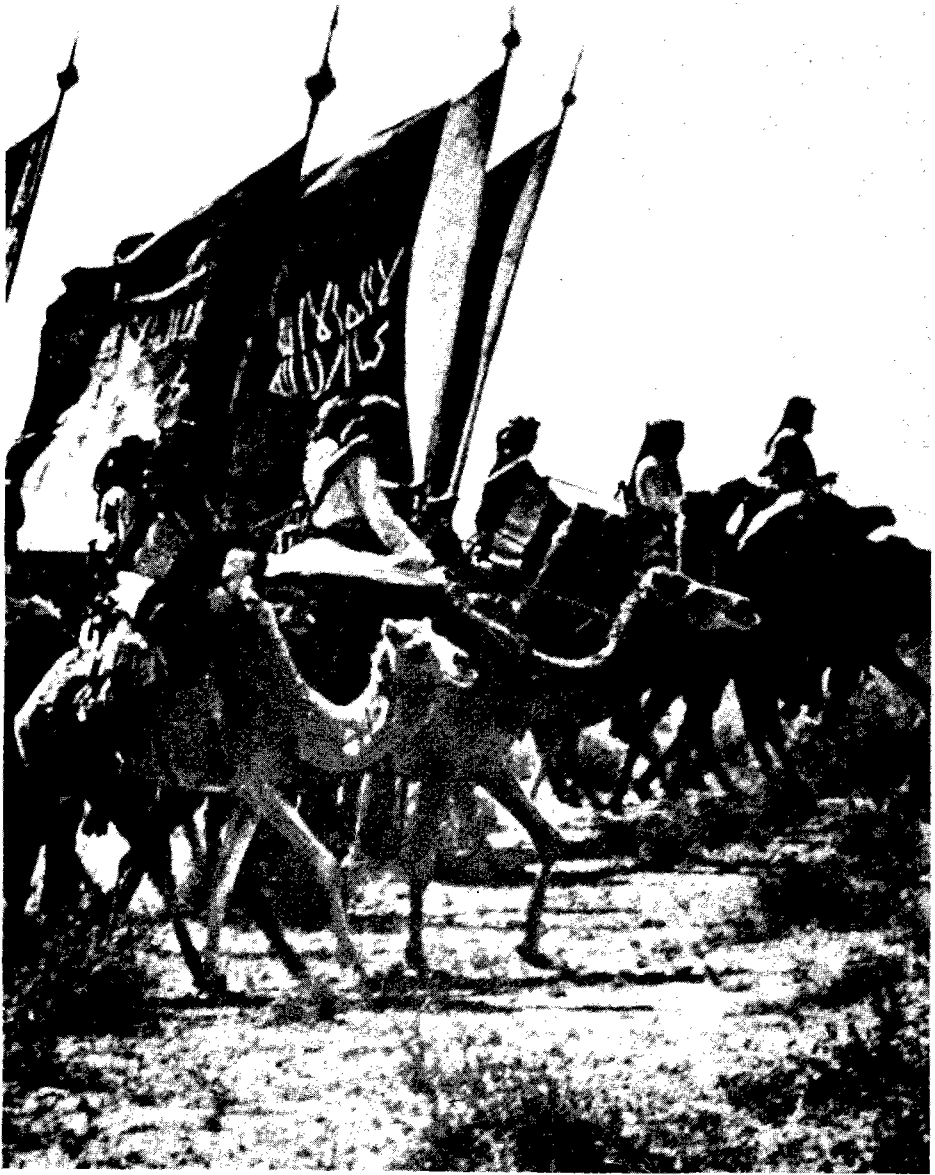
جيش السعوديين : نفس الراية لثلاثة قرون ..