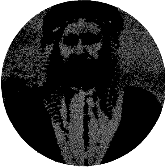
الشيخ خزعل أمير المحمرة