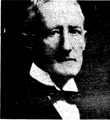
سير برسي كوكس