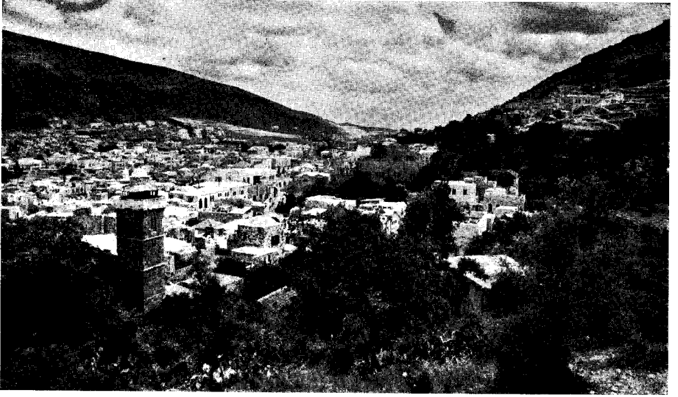
منظر عام لمدينة نابلس