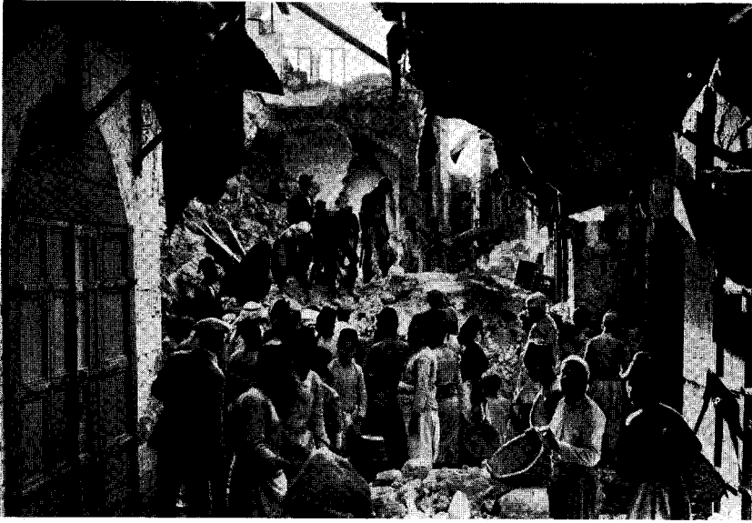
احد شوارع المدينة بعد الزلزال سنة ١٩٢٧