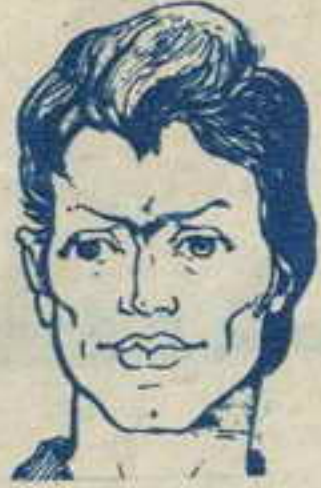
على الطريقة الأمريكية!

في الاستراحة التي تسبق عرض الفيلم .. حاولت الفتاة الحديث مع « أحمد » . كان واضحا أنها تتعمد أن تتعرف به . فجارها في الحديث ، وهو يزن كل كلمة يسمعا وكل كلمة يقولها . وفي نفس الوقت كانت أصابعه تتحسس المقعد الجالس عليه . ويعد الصفوف من الأمام والخلف . ومن اليمين واليسار ويحدث نفسه « إن « معروف » هذا رجل غريب .. فقد ترك رسالة في دار سينما حافلة بالرواد » . وانطفأت الأنوار وبدأ الفيلم . وتوالت أحداثه ، وعندما انتهى العرض وأضيئت الأنوار ارتدت الفتاة البالطو ، ثم فجأة وضعت ذراعها في ذراع « أحمد » وكأنهما صدقان .