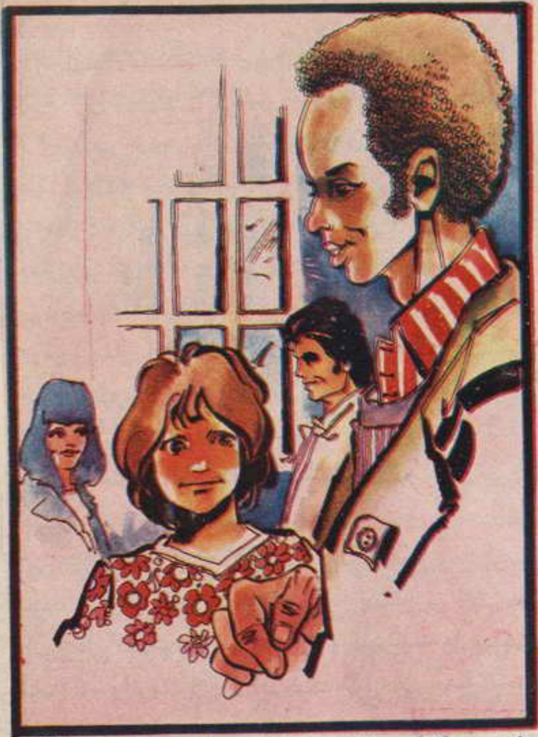
في المساء وصلت ريمًا، وسرعان ما حكى لها الشياطين أحداث الليلية ووضعوا أمامها كلمة سينما ورقم (٩٩) .. وقال عثمان، أرجوا أن تعرفي قولًا ما هي حكاية هذه الكلمة وهذا الرقم.

واجتمع الشياطين الخمسة .. وشرح لهم « أحمد » الموقف ..