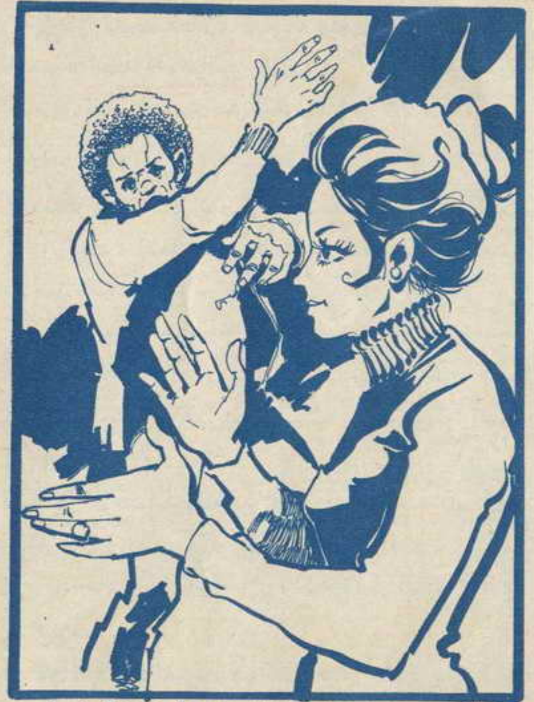
بعد ان فككت جورجيت اربطة عثمان قام وتمطى ثم قذف قبضته على وجه الرجل الجالس على الكرسي .

التفت « أحمد » إلى الرجل الواقف وقال في صرامة : ( إلى أي عيادة ؟ ) . تردد الرجل لحظات ثم قال :