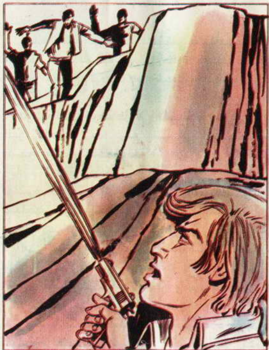
أخرج أحمد مسدسه ، ثم أطلق طلقة ضوئية خضراء أضواء الجبل .

الراحة في نفسه . ظل يرقبها ، حتى استغرق في النوم .