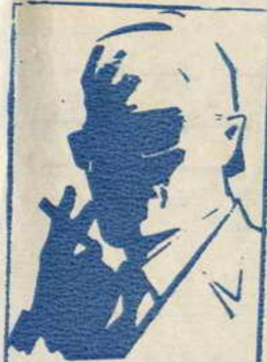
رسم عمر الزعيم القاضى الذى لا يعرف حقيقته احد ..

انهم ١٢ فتى وفتاة فى مثل معرك كل منهم يمثل بلدا عربيا . انهم يقفون فى وجه الامارات الموجهة الى الوطن العربى . . تعرفوا فى منطقة الكهف السرى التى لا يعرفها احد . . اجادوا فنون القتال . . استخدام المسدسات . . الخناجر . . الكاراتيه . . وهم جميعا يجيدون عدة لغات وفى كل مفامرة يشترك خمسة او ستة من الشياطين مما . . تحت قيادة زعيمهم القاضى ( رقم صفر ) الذى لم يره احد . . ولا يعرف حقيقته احد . واحداث مفامراتهم تدور فى كل البلاد العربية . . وتستجد نفسك معهم مهما كان بلدك فى الوطن العربى الكبير .