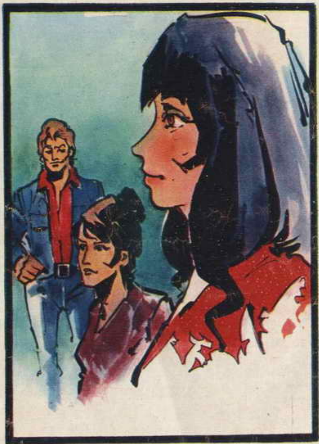
كان الشياطين الثلاثة .. الهام .. زبيدة .. أحمد .. في حالة قلق . لغياب الشيطان خالد .

يسر بمضيق جبل طارق ، إلى المحيط الأطلنطي .. وعندما يقترّب من جزر « أزورس » كان يختفي في مياه المحيط . ظل الشياطين يراقبون حركة الأسهم على الخريطة ، وأخيرا قال رقم ( صفر ) : ( كانت مهمة « خالد » .. هي التوصل إلى معلومات عن شركة النقل البحري ، التي تحدث الانفجارات في ناقلاتها ، خصوصا في تلك المنطقة القريبة من جزر « أزورس » . إن عملاءنا في العالم ، قد أرسلوا لنا رسالات متعددة عن شركة ( أزورس ) للنقل البحري ، التي تصاب ناقلاتها بالانفجارات ، لكن أحدا منهم لم يستطع أن يتوصل إلى سبب هذه الانفجارات ، وهذه كانت مهمة « خالد » .. لقد كانت المدة المحددة له عشرين يوما ، على أن يوالينا بالرسائل ، حتى نضع تصورنا الكامل لما يحدث . إلا أنه لم يعد ، ولم يرسل شيئا .. والمسألة هامة .. سواء بالنسبة لمصير « خالد » .. أو للبضائع العربية التي تنقلها الناقلات وتذهب إلى المحيط .. »