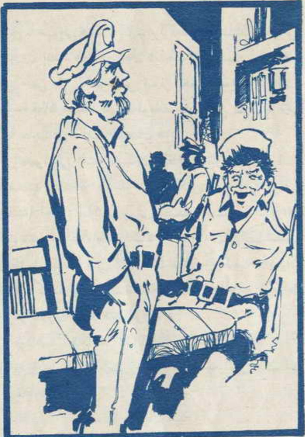
استرعى انتباه الشياطين حديث الحجارة ، كان واضحا أنهم يتحدثون عن إحدى مناقبات أزورس