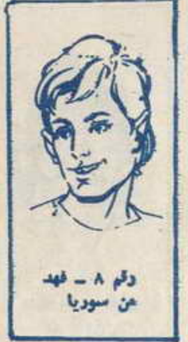
رقم ٨ - عهد من سوريا