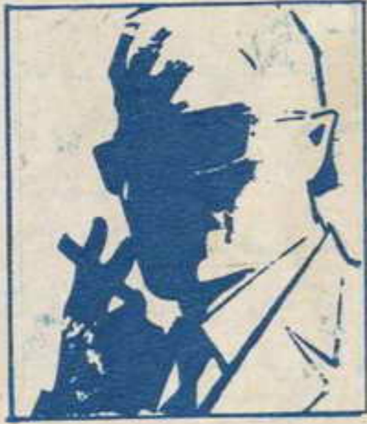
الشياطين ١٢ - صفر

كانت هذه هي المرة الأولى ، التي يدخل فيها الشياطين إلى قاعة الاجتماعات ، وقد نقصوا واحدا . . فمنذ بدأوا مغامراتهم ، وهم دائما ١٣ . ولذلك ، فإنهم عندما أخذوا أماكنهم داخل القاعة ، كان هناك سؤال واحد يتردد في أذهانهم : أين ذهب « خالد » ؟ وماذا حدث له ؟ إنهم يعرفون أن « خالد » قد ذهب في مهمة سرية ، لم يخبرهم بها رقم « صفر » غير أن المدة المحددة له كانت قد انتهت ، وهذا ما جعلهم يتساءلون : ماذا حدث له ؟ إنه منذ خرج في مهمته السرية ، لم يرسل رسالة واحدة ، لا إلى رقم « صفر » ولا إلى الشياطين ، مع أن هذه ليست عادتهم