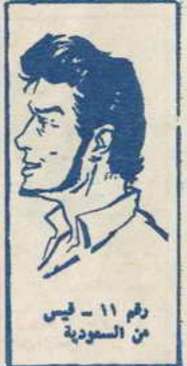
رقم ١١ - فيس من السعودية