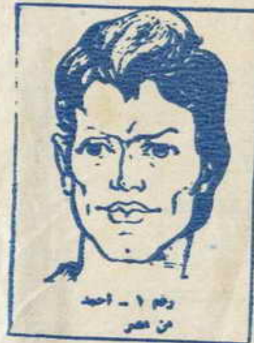
رسم ١ - احد من مصر

انهم ١٢ فتى وفتاة فى مثل معرك كل منهم يمثل بلدا عربيا . انهم يقفون فى وجه الامارات الموجهة الى الوطن العربى . . تعرفوا فى منطقة الكهف السرى التى لا يعرفها احد . . اجادوا فنون القتال . . استخدام المسدسات . . الخناجر . . الكاراتيه . . وهم جميعا يجيدون عدة لغات وفى كل مفامرة يشترك خمسة او ستة من الشياطين مما . . تحت قيادة زعيمهم القاضى ( رقم صفر ) الذى لم يره احد . . ولا يعرف حقيقته احد . واحداث مفامراتهم تدور فى كل البلاد العربية . . وتستجد نفسك معهم مهما كان بلدك فى الوطن العربى الكبير .