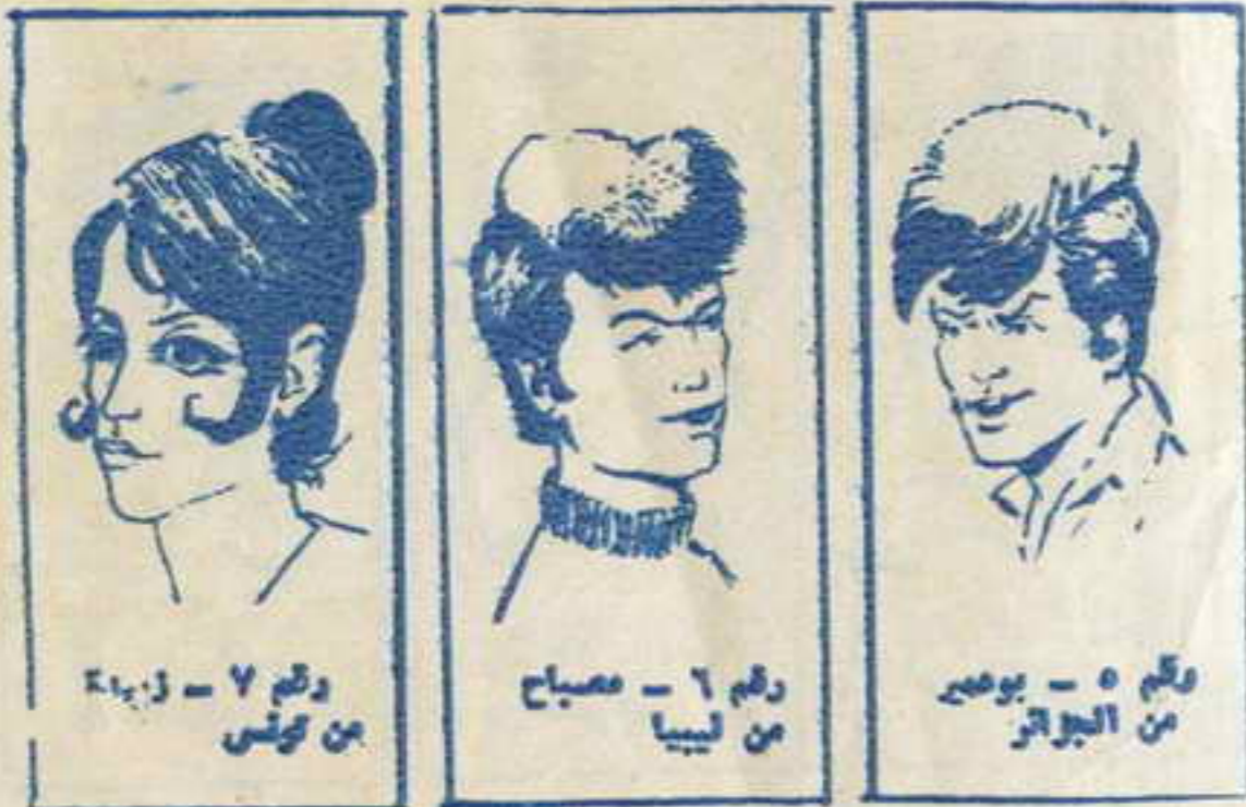
رسم ٧ - زينة من تونس