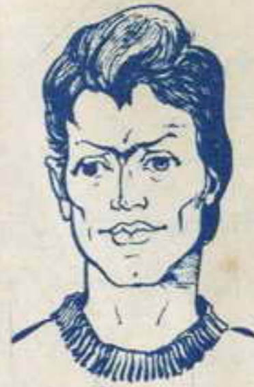
مغامرة مع زورق آخر!

إقترب الزورق الآخر ، حتى لامس زورق الشياطين ، وظهر ضابط بحرى ، قال : من أتم ؟ أجاب « أحمد » بسرعة : إننا من هواة الصيد ؟