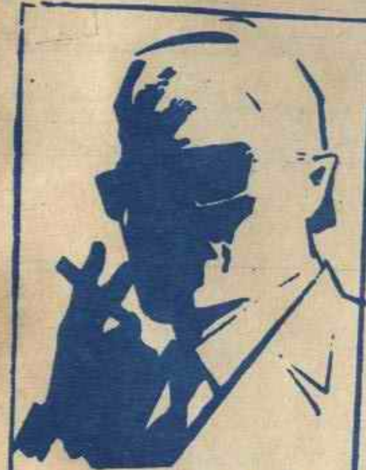
رقم صفر الزعيم الفاضل الذي لا يعرف حقيقته احد ..