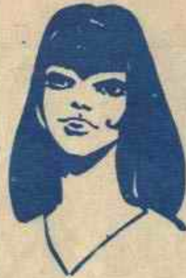
رقم ٢ - الهام من لبنان