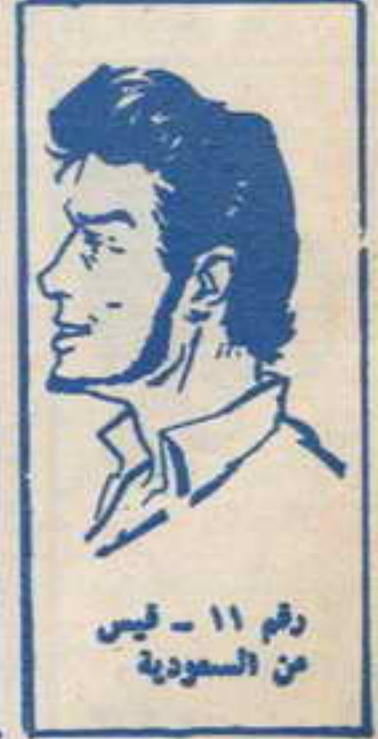
رقم ١١ - فيس من السعودية