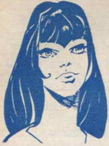
حديثا بعد منتصف الليل!

كان الظلام قد بدأ يهبط على مدينة « سياتل » ، حينما كانت السيارة التي تقل الشياطين الخمسة تسير في شوارعها الواسعة ، وأضوائها تشق الظلام ، فتضيء أرضها المنزلة من أثر الأمطار ، التي كانت تنهمر طوال اليوم . كانت علامات التعب والارهاق واضحة على وجوه الشياطين الخمسة ، بعد المعركة الرهيبة التي تمت بينهم وبين عصابة سادة العالم ، على شاطئ « سيورد » ، والتي على أثرها استطاع « عونى » الفرار ، بعد مساومته مع « أحمد » ، فى سبيل إطلاق سراح « فهد » و « بوعير » ، والتي خرج منها الشياطين بمجموعة وثائق ضخمة وهامة جدا .