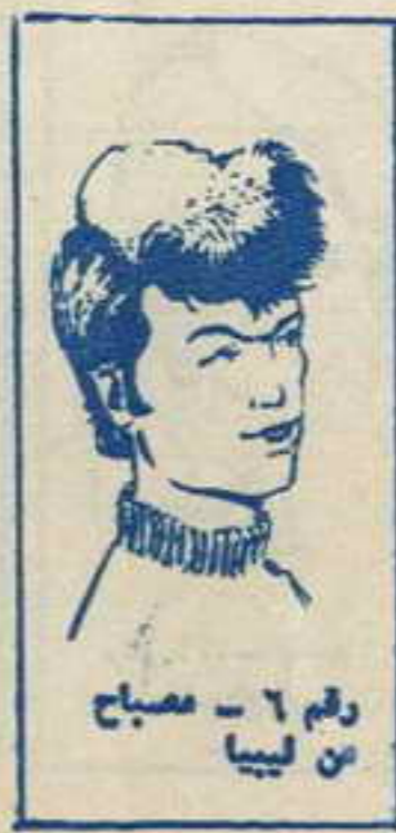
رقم ٦ - مصباح من ليبيا