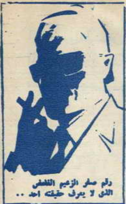
رقم صفر الزعيم اللطيف الذي لا يعرف حقيقته احد ..