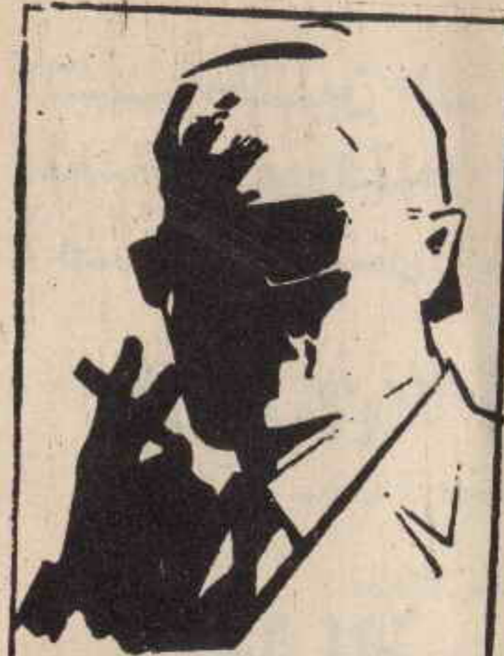
رقم صفر الزعيم القامض الذي لا يعرف حقيقته احد ..