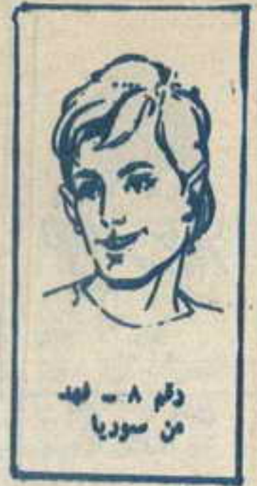
رقم ٨ - لهد من سوريا