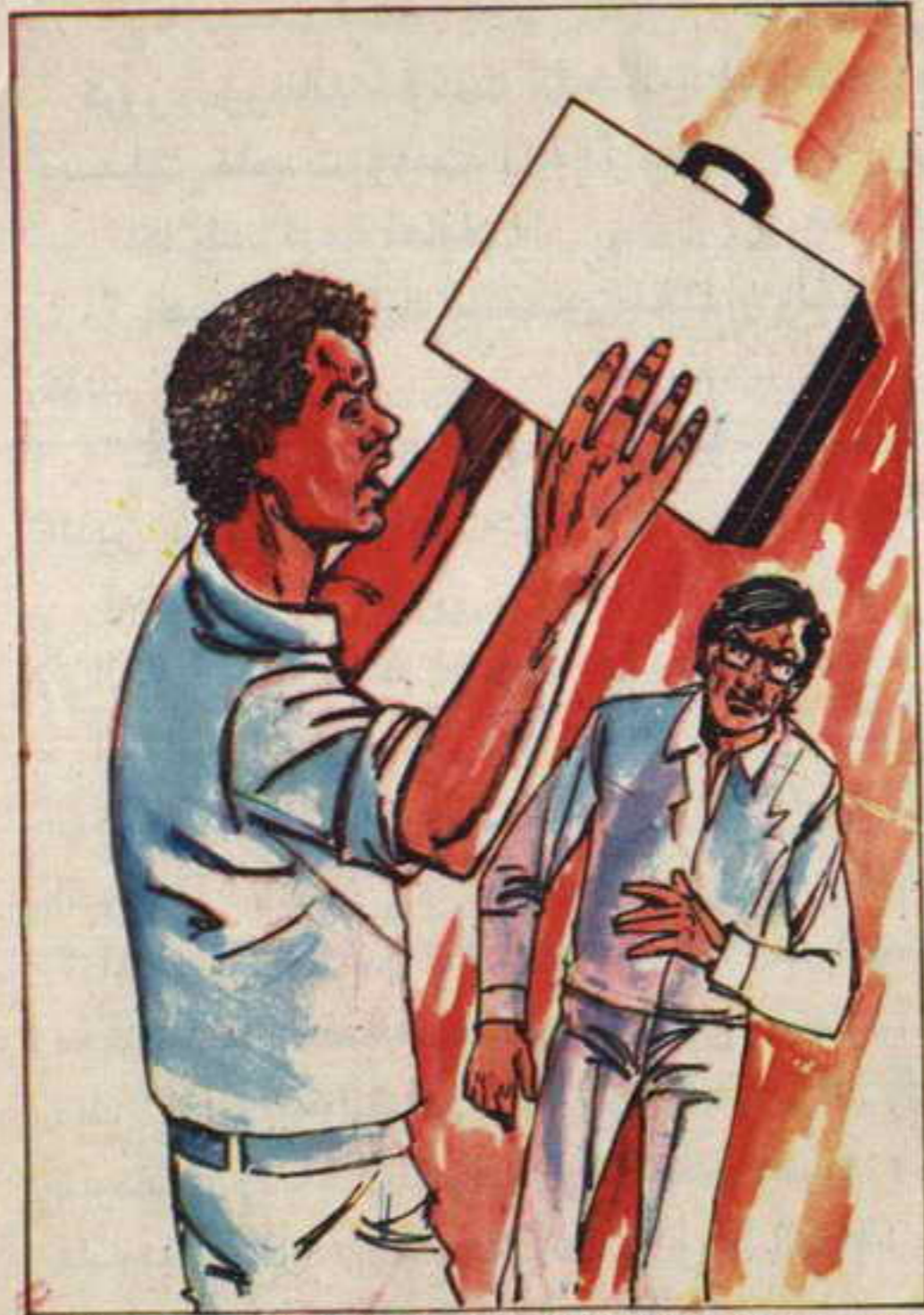
خطف عثمان العقيبة من كلارك دون كلمة واحدة ثم قال له بصوت أمر: أتبعني والأسيقتك، كروز.!

أريد النقود ، وفي نفس الوقت أدرك ان الرجال الثلاثة يستغلونني في أعمال غير مشروعة .. خاصة وان الاسماء تعددت ... ولن تعد اسما واحدا كما قالوا في البداية .. وقررت الاتصال بالبوليس ولكن " لتل ماك " قال لي انني متورط معهم في السرقة وانني ساحاكم .. ولم يعد امامي الا الرضوخ .. ولكن البنوك بدأت تدرك ما يحدث .. وثارت ضجة كبيرة في أمريكا .. وقال " لتل ماك " ان علينا ان نرحل سريعا قبل ان يصلوا الينا .. واخبرني ان رجلا يدعى " كروز " على استعداد لشراء الجهاز وتطويره مقابل مبلغ كبير .