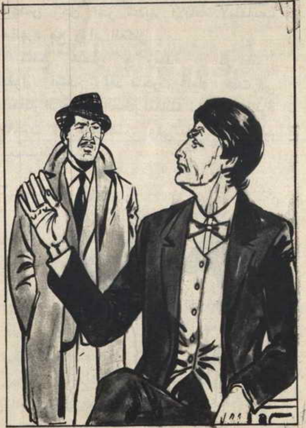
بدأ الضيق على وجه الرجل الأنيق وقال : أنتى لا أحب هذه الألاعيب يا " لتل ماك " !

بدأ الضيق على وجه الرجل الأنيق وقال : " أنتى لا أحب هذه الألاعيب يا " لتل ماك " ! تأكد " عثمان " و " زبيدة " انه " لتل ماك " وهمس " عثمان " فى أذن " زبيدة " : " أسرعى الى مكان السيارتين ، أخبرى " أحمد " بما حدث وعودوا جميعا الى هنا ! " زبيدة " واذا لم نجدك ؟ " " عثمان " : " أكون قد انطلقت خلف الرجل " لتل ماك " ! انطلقت " زبيدة " مسرعة .. وعاد " لتل ماك " يقول للرجل : " اننى لا أكذب عليك .. لقد كنت متفقا معه على كل شىء .. وأنا صاحب مصلحة ! " " الرجل " " اننى لا أستطيع أن أبقى فى " لندن " أكثر من ذلك ! " " ماك " : " اعطنى فقط مهلة ٢٤ ساعة .. وستقابل الرجل . !