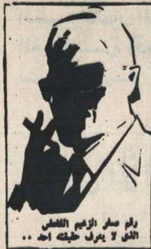
رقم صفر الزعيم الفاضل الذي لا يعرف حقيقته احد ..