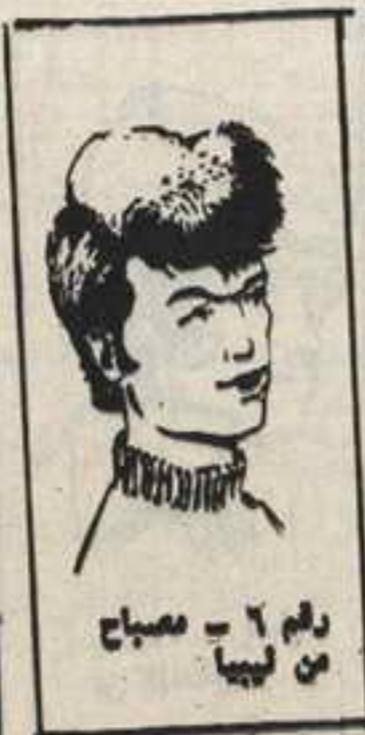
رقم ٦ - مصباح من ليبيا