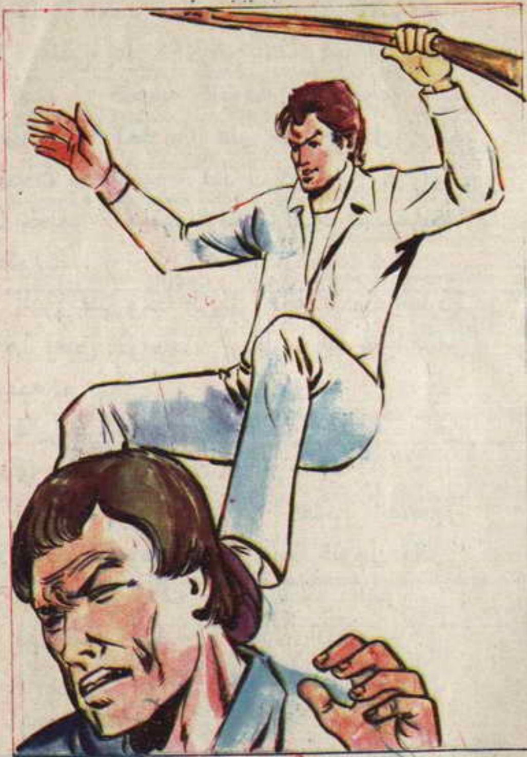
فجأة تدحرج أحمد سريعاً، ثم قفز واقفاً، وجرى وتعلق بنصف شجرة ثم ضرب بقدمه رأس رجل كان يطلق النار عليهم وترنح الرجل.

" أحمد " : " هرب ! " " عثمان " : " لا .. هناك تحركات مريبة حولنا ! "