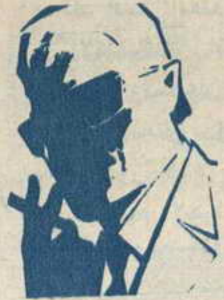
لص من نوع جديد!

لص من نوع جديد! قال رقم (صفر) وهو يتحدث من خلف الكابينة الزجاجية السوداء: " أن التقرير الذي تلقيته أمس .. اقل ما يوصف به أنه تقرير مذهل .. أنه يتحدث عن لص الكتروني .. وقد عرفنا أنواعا وأشكالا من اللصوص والمجرمين ، ولكن هذا اللص من نوع جديد علينا "