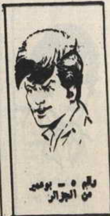
رقم ٥ - بوعصب من الجزائر