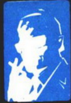
رغم صغر الزعيم العناصر الذي لا يعرف مصفحه احد