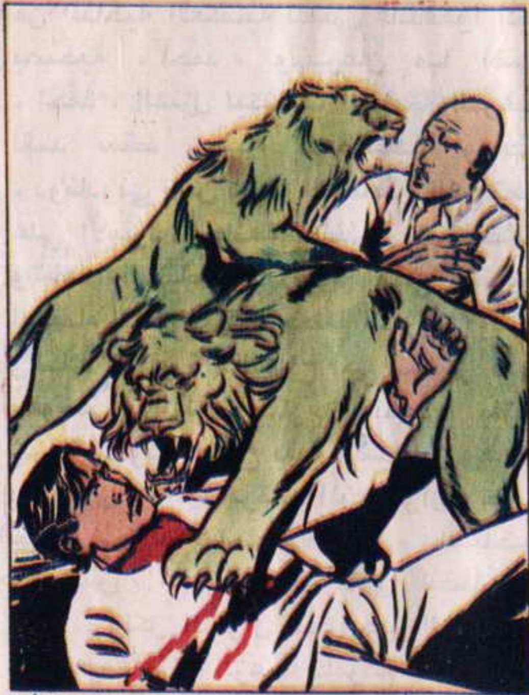
شاهد الشياطين الأسود وهي تغترب الزعماء الذين أغرقوا منطقة الشرق الأوسط والبلاد الفقيرة بالسلاح.

واستغاثاتهم وقد أمسك كل منهم بمدفع سريع الطلقات .. وكان « دونادوني » أول من أطلق مجموعة من الرصاص لارهاب الشياطين الذين تسمروا في أماكنهم عدا « عثمان » الذي زحف على الأرض ليختبئ تحت أحد الكراسي المنتشرة بالمنزل وأخذ يراقب من وضع الانبطاح ما يدور . كان الزعماء قد فوجئوا بما يحدث فنسوا « أحمد » على كرسي الاعتراف الذي يكشف الكذب فاندفع « أحمد » ناحية مصدر الكهرباء وسرعان ما نزع الوصلات الخاصة بالمنزل ليتحول في ثوان إلى ظلام حالك فزاع له « دونادوني » فأخذ يطلق النار من سلاحه بطريقة عشوائية وهو يركض وخلفه « ماكس » الرجل القنبلة وقد أمسك هو الأخر بسلاح وأخذ يطلق دون أن يدري ومن خلفهما « جون بوستر » و« لورا » الساحر وفجأة سمع الشياطين صياحا عاليا يصدر