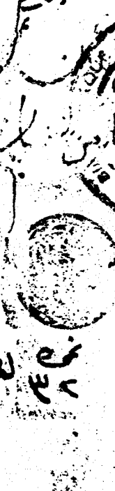
صورة غلاف نسخة المكتبة الظاهرية بدمشق

ليس تعلم من كثرة التكرار والامير بل هو نور من عند الرحمن انقل صوره نور ووضوح شيبى عبور ما عباد الله توبوا ان ذاقتم عيبه من يرد بعد بالثبير الذنوب ابادوا صلوا وضوا ان مفتاح القلوب ليس من قلبه واه كل قصد في رضاه ما نام ولا سواه ثم اذ اجرت الظلام تشبه باعلامه في الذي ضاموا في السحر اكل نياجه باعباده من سخرهم ثم من في البر ما قد فعنا العبا يا وسدنا في التوا وقصنا في السير خوفنا من النار سعير هكذا حال الفقير العالين كن لنا عوننا وبقنا احب