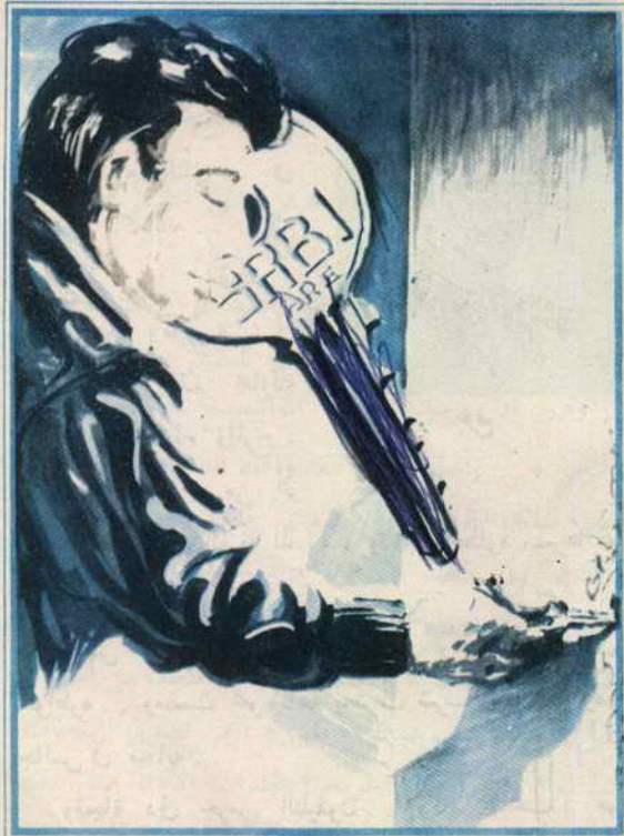
وجد «تختخ» الحل... مد يده يهدوه شديد وسحب المفتاح من الباب

الباب ، وفي خطوات قليلة كان في غرفته ، وأخرج دفتر مذكراته وقلمه .. ووضع المفتاح على الصفحة البيضاء ، ودار حوله بالقلم .. وحصل بهذا على المقاسات الدقيقة للمفتاح ، ثم فعل الشيء نفسه لبقية المفاتيح .. وعاد مسرعاً إلى المر و نظر .. كان كل شيء على ما يرام ، وأسرع يدس المفتاح مكانه ثم يعود إلى غرفته ويغلق الباب عليه ويتمدد .