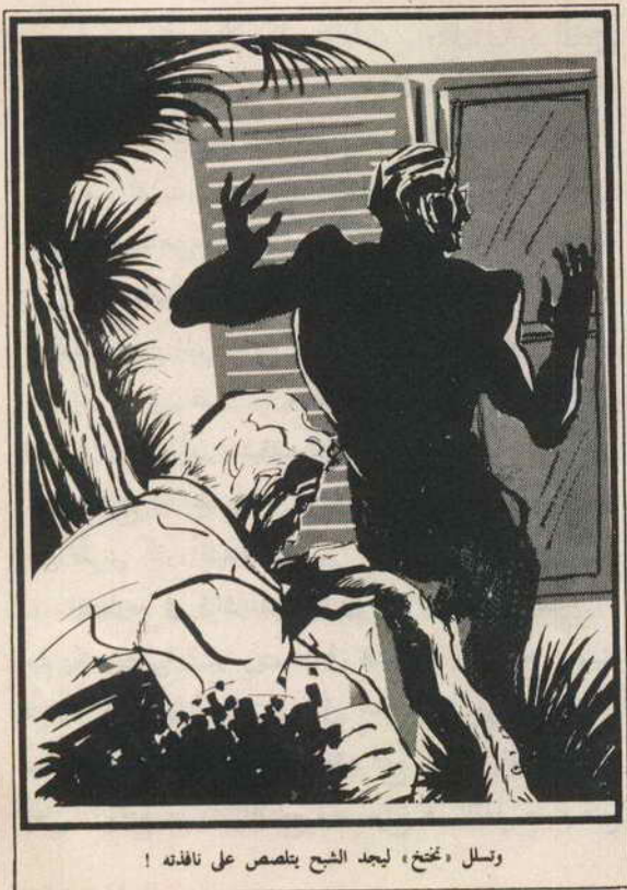
وتسلل «تختخ» ليجد الشيخ يتلصص على نافذته !

النسانيس تطلق صفيها الحاد بين لحظة وأخرى .. وانحى «تختخ» وانبطح على الأرض ووضع أذنه عليها .. كانت هذه أفضل وسيلة ، لسماع صوت أقدام أو حركة فوق الأرض .. وسرعان ما التقطت أذنه صوت الأقدام .. فوقف واتجه إليها بهدوء .. واستطاع برغم الظلام الذي يخيم على الحديقة ، من أن يرى في الأضواء البعيدة ، شيخ شخص يقف بجوار نافذة غرفته .. وكان واضحاً أن الشيخ يحاول النظر .. من خلال المصراع الخشبي ليرى ما يدور في الداخل .. كان من الصعب جداً ، أن يتبين ملامح الشيخ .. وأخذ يفكر بسرعة فيما ينبغي عمله .. هل يتركه ينصرف حتى يرى ماذا يريد ؟ هل يلتحم معه ؟ ! هل يصرخ في طلب النجدة !