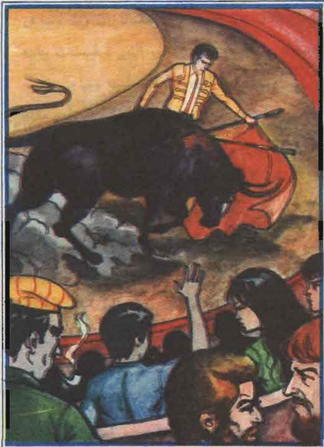
«شاهد الأصدقاء» (الماتادور) وهو مجهز على التور الجريح.

له ، وسوف يقوده إلى «البارون» عقب المباراة . وصاحت «أروى» وهي تطالع برنامج الحفل : سوف نشهد «الماتادور» العظيم «الكوردوبيث» !! والتفت إليها المغامرون الثلاثة في دهشة . فأوضح «إبراهيم» قائلاً : «الماتادور» هو مصارع الثيران ، و«الكوردوبيث» تعني «القرطبي» نسبة إلى مدينة «قرطبة» الأندلسية ، ويسمونها الآن «كوردوبيا» . وأشار مساعد «مانويل» إلى حجرة صغيرة في أحد ممرات المبنى وهو يقول : هذه غرفة «الكوردوبيث» . وتعلق «عامر» بذراعه وقال في رجاء : أريد أن أشاهد المصارع العظيم .