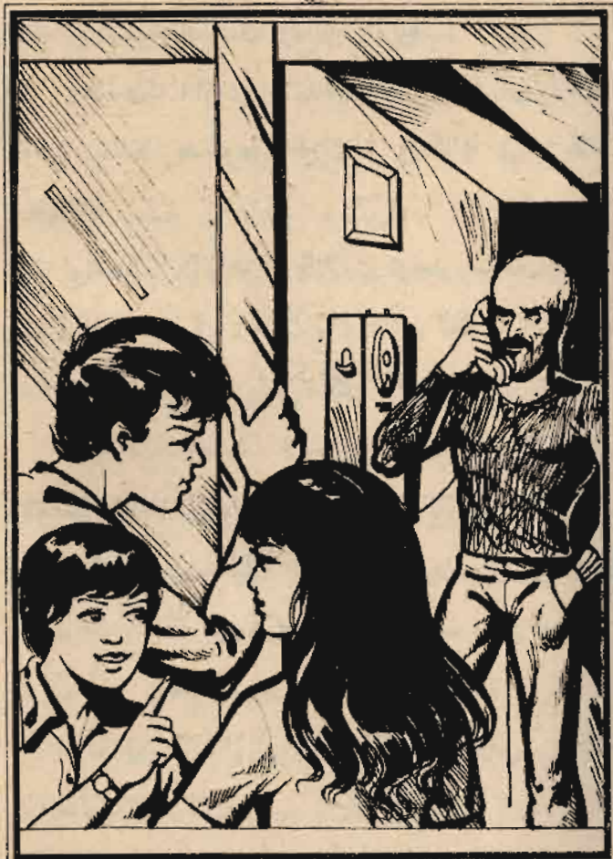
وشاهد المغامرون الثلاثة «بدر» وهو يتحدث في التليفون ..

وأتجه العميد «سبيرو» ناحية كشك الصحف ، وتحدث مع العميد «مانويل» وهو يتظاهر بتصفح بعض المجلات المعروضة - خشية أن يكون هناك من يراقب المكان من رجال العصابة - ثم عاد إلى «الكافيتيريا» بعد شراء صحيفة .