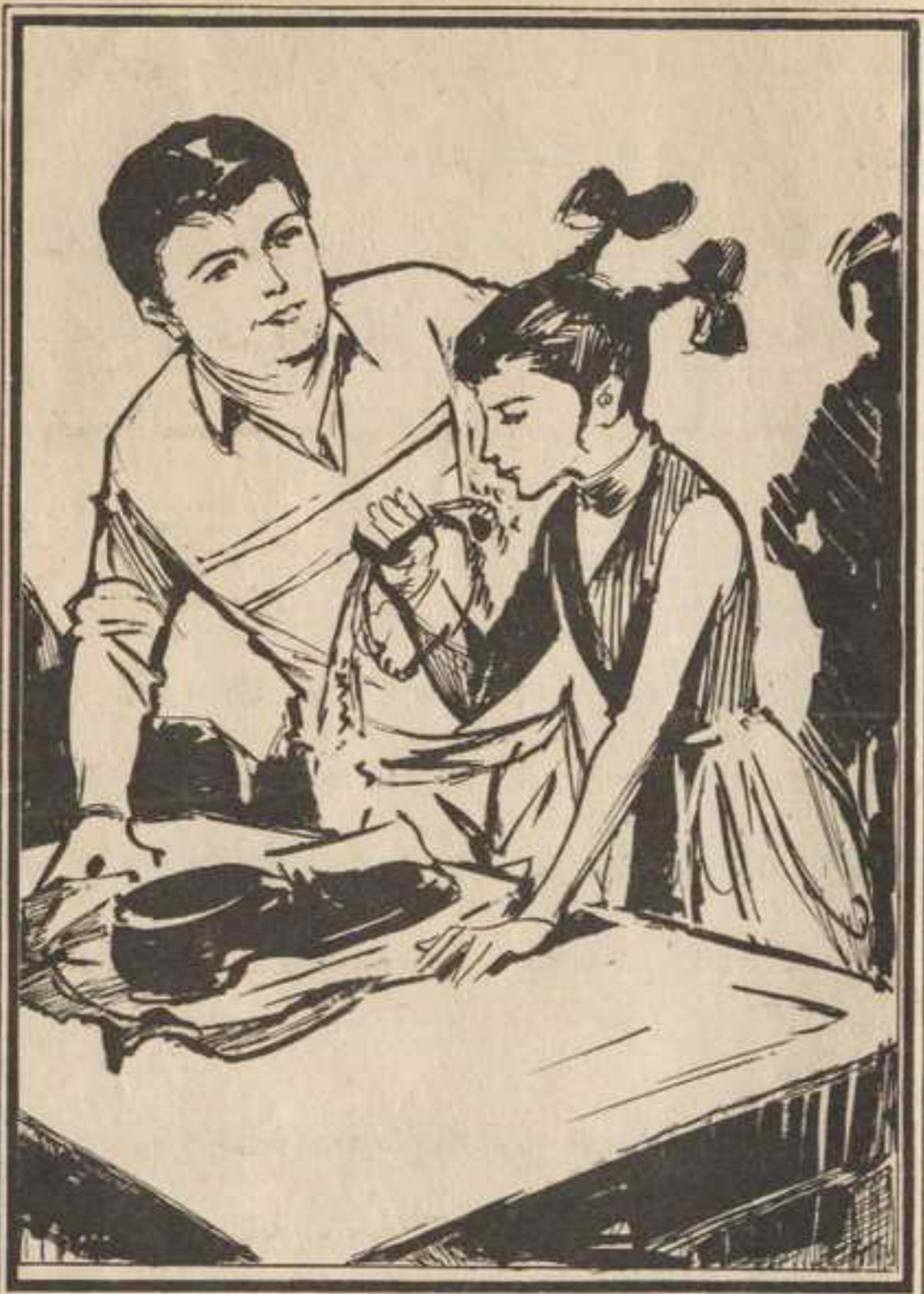
قال «تختخ»: لقد فتحت الباب لصبي الكواء فوجدت هذه اللفة على السلام.