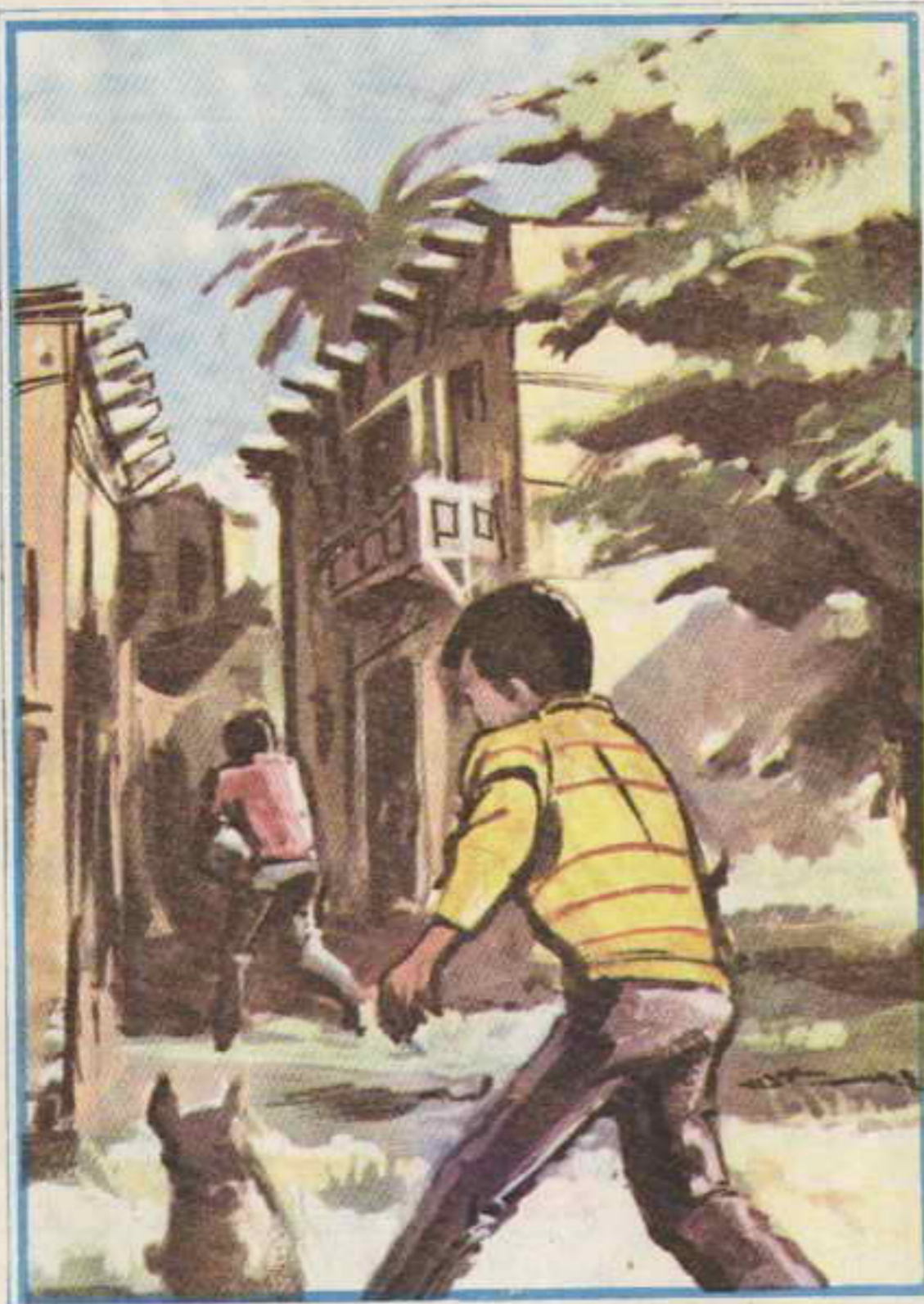
انطلق «عجب» وراء الولد الذي أخذ يجري في الخواري الفارغة